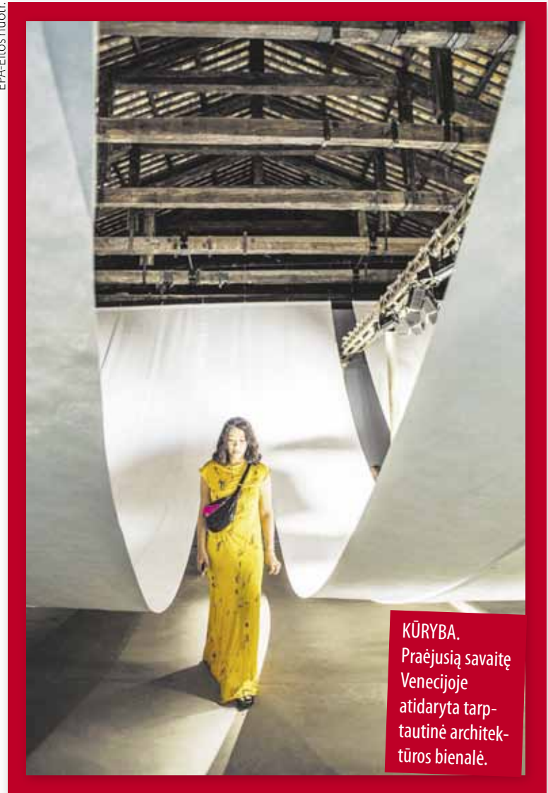
KŪRYBA. Praėjusių savaitę Venecijoje atidaryta tarptautinė architektūros bienalė.