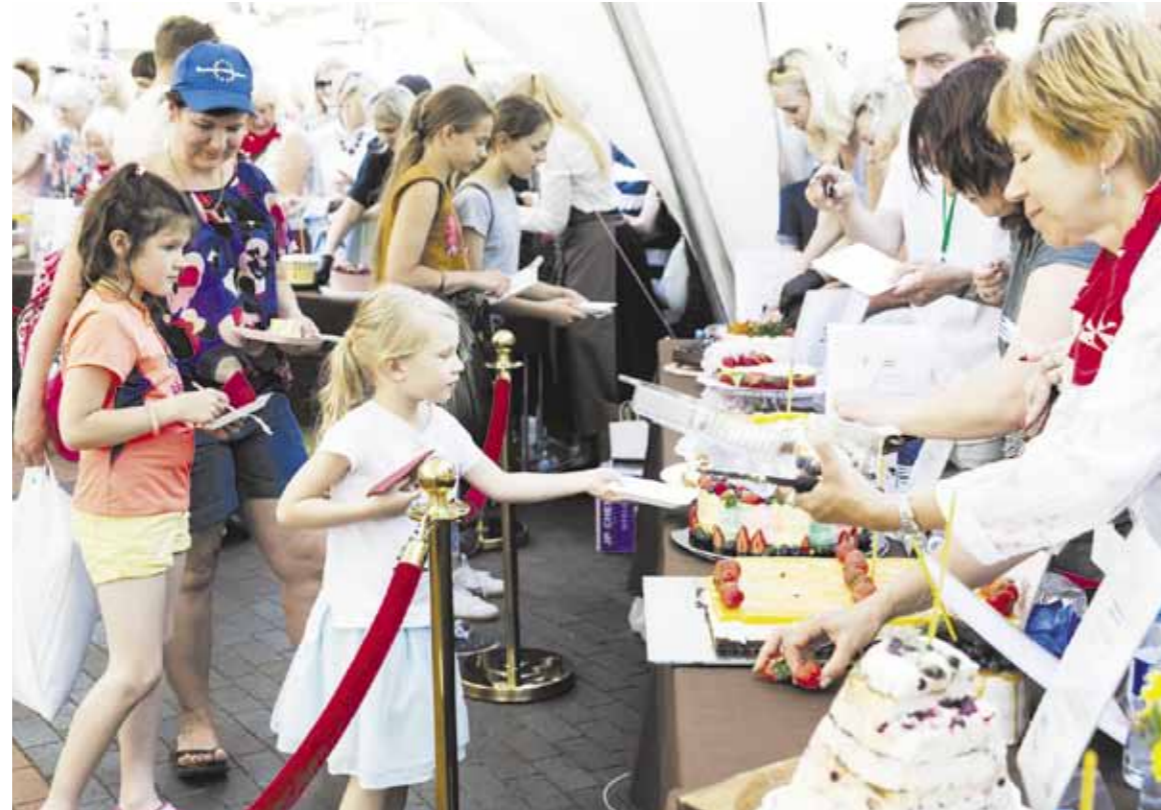
Paragauti tortų susirinko tiek mažieji, tiek suaugusieji smalsižiai

Po sveikinimo kalbų ir dainų, šventės dalyviai pakviesti degustuoti projekto „100 tortų Lietuvai“ dalyvių skanėstus. Tiesa, pirmasis kiekvieno torto gabalėlis atiteko Maltos ordino globėjams senoliams Druskininkuose, kaip simbolinė organizatorių padėka ordino savanoriams už pagalbą renginio metu.