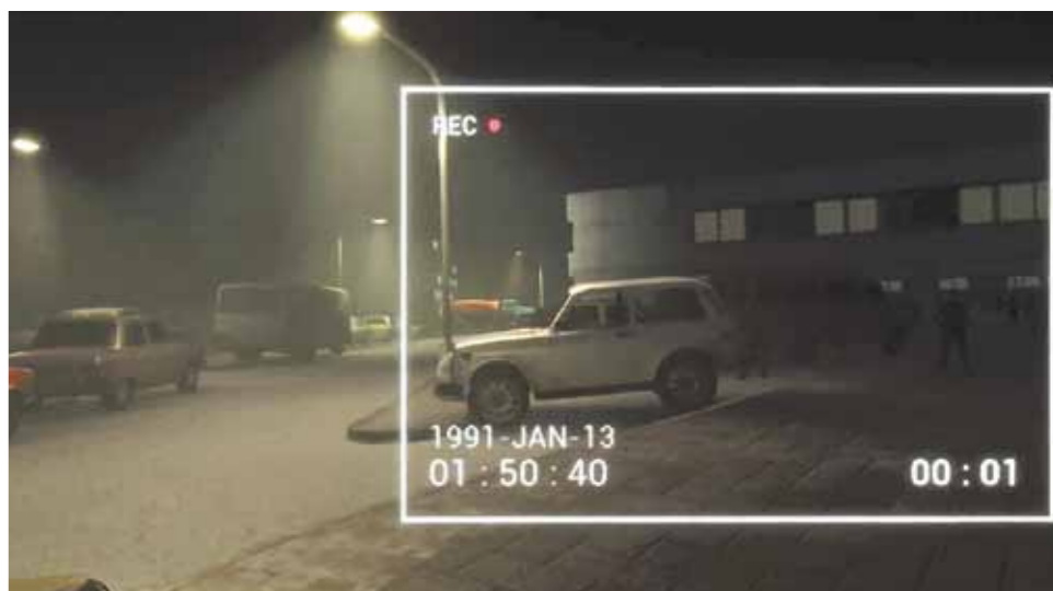
Projektų „Nupučiama siena“ ir „Laisvės kodas 13“ kadrai