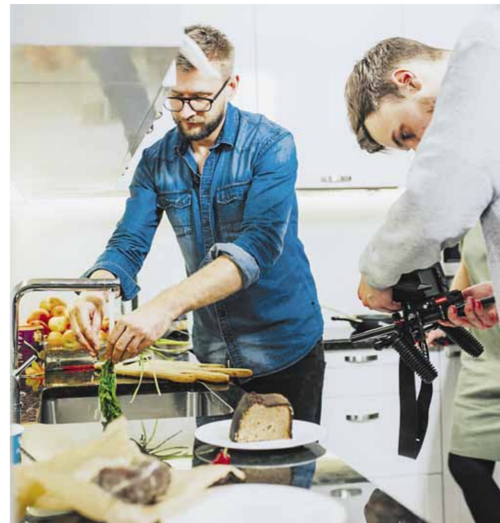
Nauja Alfo laidos koncepcija - eiti į paprastų žmonių namus ir gaminti iš to, ką randa šaldytuve

- Nėra tokių dalykų, kurie galėtų mane nustebinti. Net į šaldytuvą nelendu, kol kameros neįjungtos - pats noriu iššūkių. Jei prieš laidos filmavimą žinočiau, kokius produktus rasiu, pradėčiau galvoti naujus receptus, neliktų netikėtumo, tektų vaidinti prieš kameras. O aš šioje laidoje noriu kuo natūralesnio efekto.