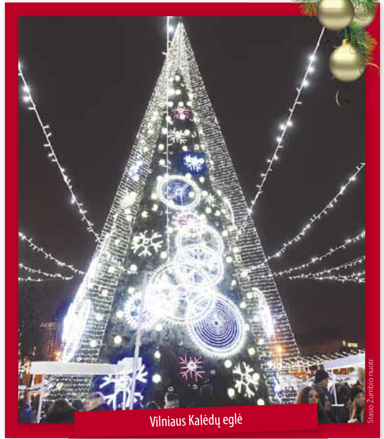
Vilniaus Kalėdų eglė