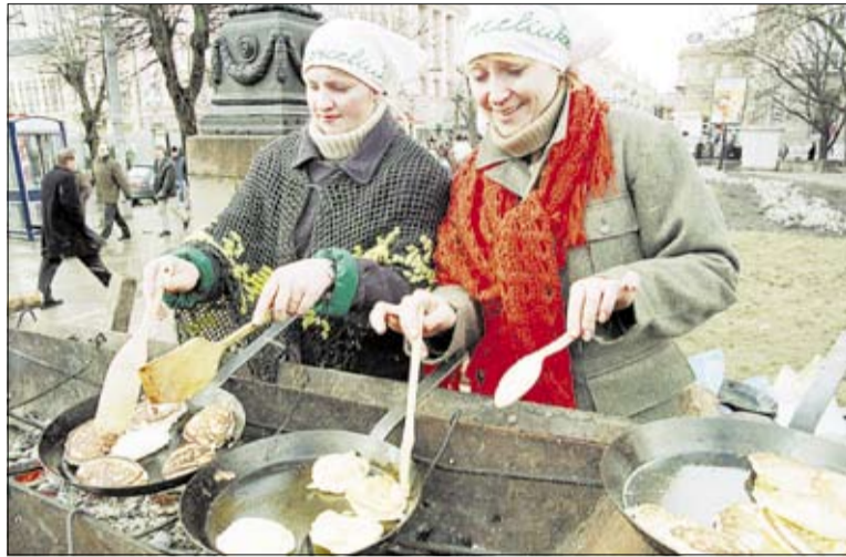
► Blynai siejami su vaisėmis protėvių vėlėms

Javų derlumą, gyvulių vaisingumą, sveikumą, bendrą ūkio gerovę prieš ir per Užgavėnės stengiamasi užsitikrinti daug ir riebiai valgant. Paskutinis ketvirtadienis prieš Užgavėnės vadintas „riebuliu četvergu“. Šią dieną buvo privalu pradėti užsigavėjamą riebiais pusryčiais. Dzūkijoje dažniausiai krosnyje šutindavo kiaulės kojas ir ausis. Sekmadienį prieš