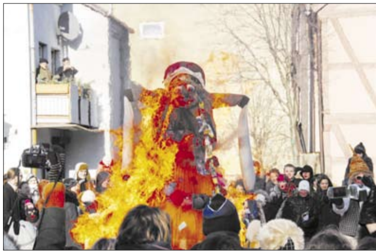
► Užgavėnių Morė šventei baigiantis sudeginama

Užgavėnės valgydavo septynis kartus, pirmadienį - devynis, o Užgavėnių antradienį - net iki dvylikos kartų. Stebuklingi skaičiai „septyni“, „devyni“ rodo, kad tiek kartų valgyta ne siekiant prikišti pilvą - tikėta, kad sotas valgis gali nulemti gerą ateitį. Tai gi valgymas buvo privaloma apeigų dalis. Valgymas septynis kartus ar septyni valgiai ant stalo galėjo sietis su ateinančia septynių savaitių pasninkine gavėnia. Skaičius „dvylika“ galėjo reikšti tikėjimą, kad gausiai prisivalgęs per Užgavėnės sotas busi visus metus.