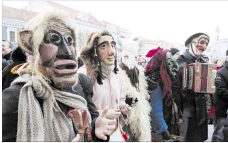
► Persirengėlių vaikštynėmis siekiama atsikratyti žiemos