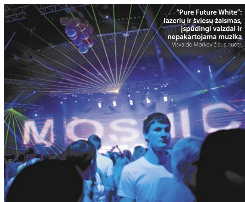
"Pure Future White": lazerių ir šviesų žaismas, išpūdingi vaizdai ir nepakartojama muzika