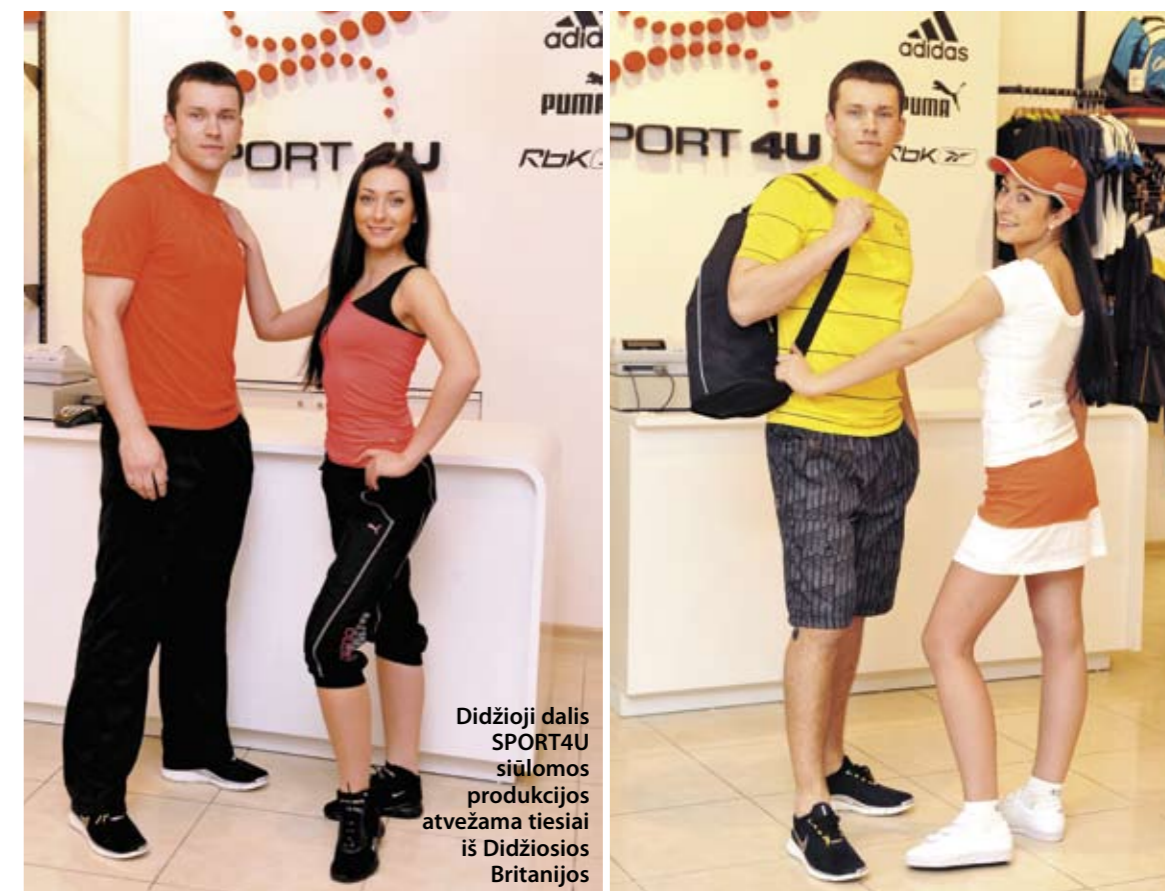
Didžioji dalis SPORT4U siūlomos produkcijos atvežama tiesiai iš Didžiosios Britanijos