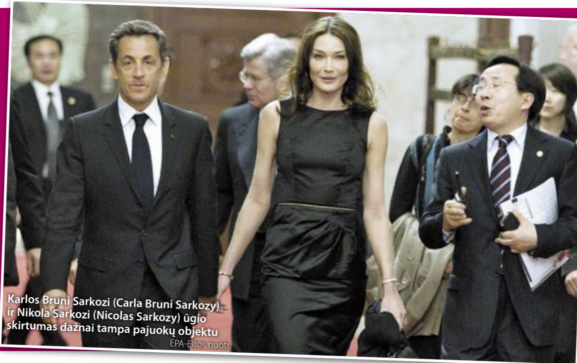
Karlos Bruni Sarkozi (Carla Bruni Sarkozy) ir Nikola Sarkozi (Nicolas Sarkozy) ūgio skirtumas dažnai tampa pajuokų objektu.

dame Bruni. Nehmen Sie sich einen kleinen Franzosen). Kompanijos "Sixt" atstovai reklamą pavadino "tiesiog žaisminga" ir patarė ją nežiūrėti rimtai. Kaip skelbia laikraštis "The Daily Telegraph", Prancūzijos prezidento ir jo žmonos Karlos Bruni Sarkozi (Carla Bruni Sarkozy) ūgio skirtumas dažnai tampa pajuokų objektu. N.Sarkozi iš tiesų yra vienas žemiausių pasaulio lyderių. Už jį mažesni tik Šiaurės Korėjos lyderis Kim Čen Iras (Kim Jong-il) ir Rusijos prezidentas Dmitrijus Medvedevas.