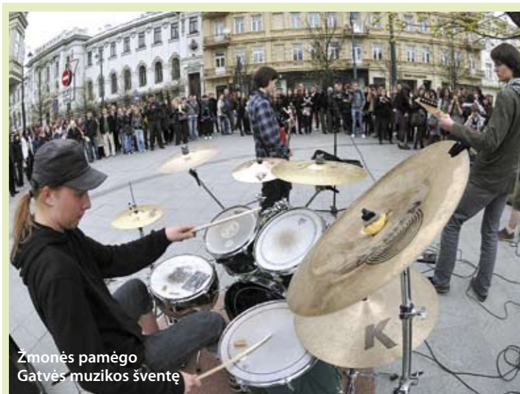
Žmonės pamėgo Gatvės muzikos šventę