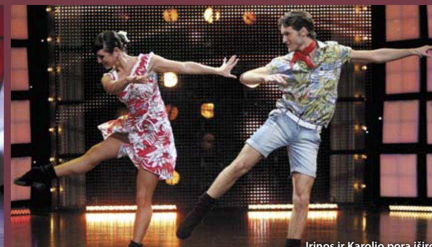
Irinės ir Karolio pora iširo - pastarasis gavo palikti "Tu gali šokti" aikštelę