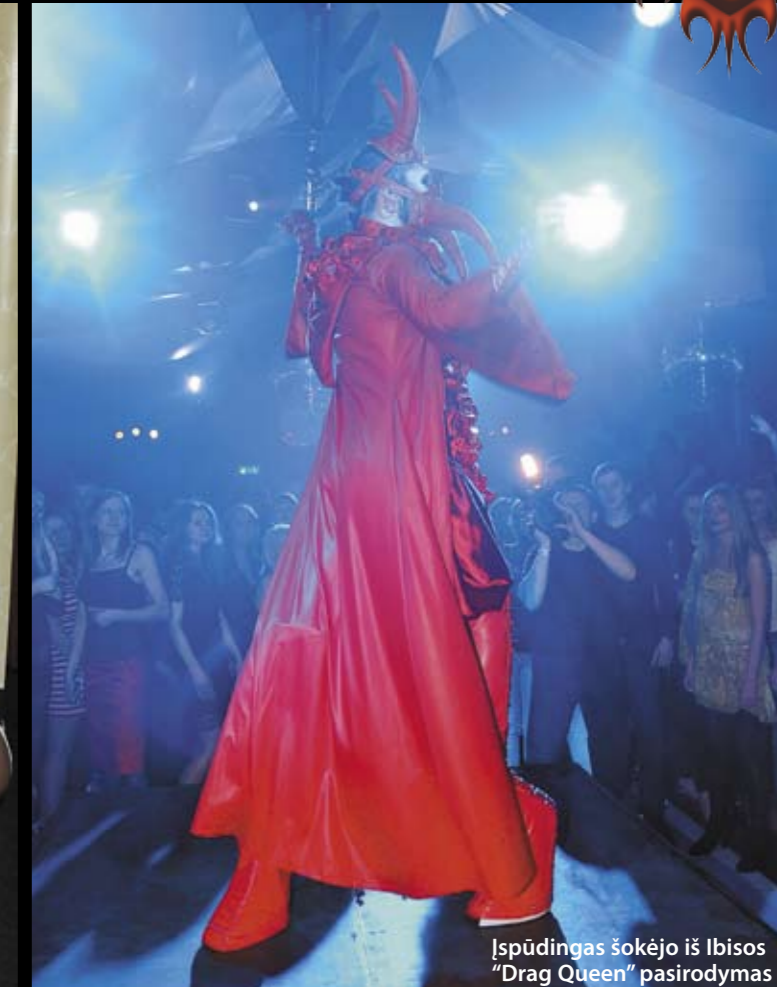
Išpūdingas šokėjo iš Ibisos "Drag Queen" pasirodymas

Pentadienį, po "Olialia" mergaičių atrankos, "Olialia" komanda visus vilniečius ir miesto svečius pakvietė į saulėtąjį "People from Ibiza" vakarėlį! Prie pulto stėjo garsiausi šios vakarėlių salos diskžokėjai, sutikome žaviausias merginas ir nuo jų akių negalinčius atitraukti vaikus... Kitokia nei įprastai "Olialia Party" vakarėlio atmosfera ir muzikiniai ritmai nepaliko abejingo nė vieno! Klubo "Pacha" lankytojus sužavėjo ir kaip niekada stilingos "Olialia" mergaitės, jos pristatė "Safilo Group" - vasarišką "Gucci", "Carrera", "Dior", "Giorgio Armani" ir "Emporio Armani" saulės akinių kolekciją. Kitas "Olialia Party" vakarėlis naktiniame klube "Pacha" jau gegužės 28 d. su populiariausių klubinių hitų autoriais "Sash!".