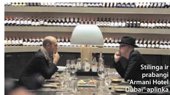
Stilinga ir prabangi "Armani Hotel Dubai" aplinka