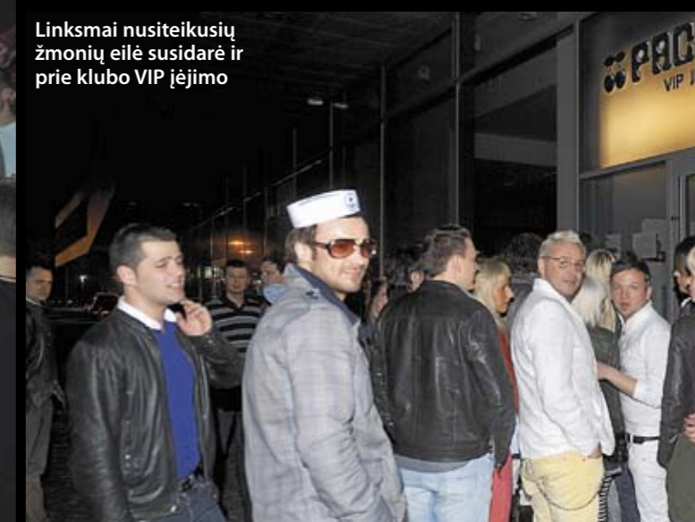
Linksmai nusiteikusių žmonių eilė susidarė ir prie klubo VIP įėjimo