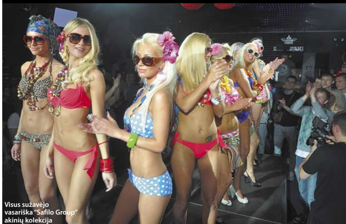
Visus sužavėjo vasariška "Safilo Group" akinių kolekcija