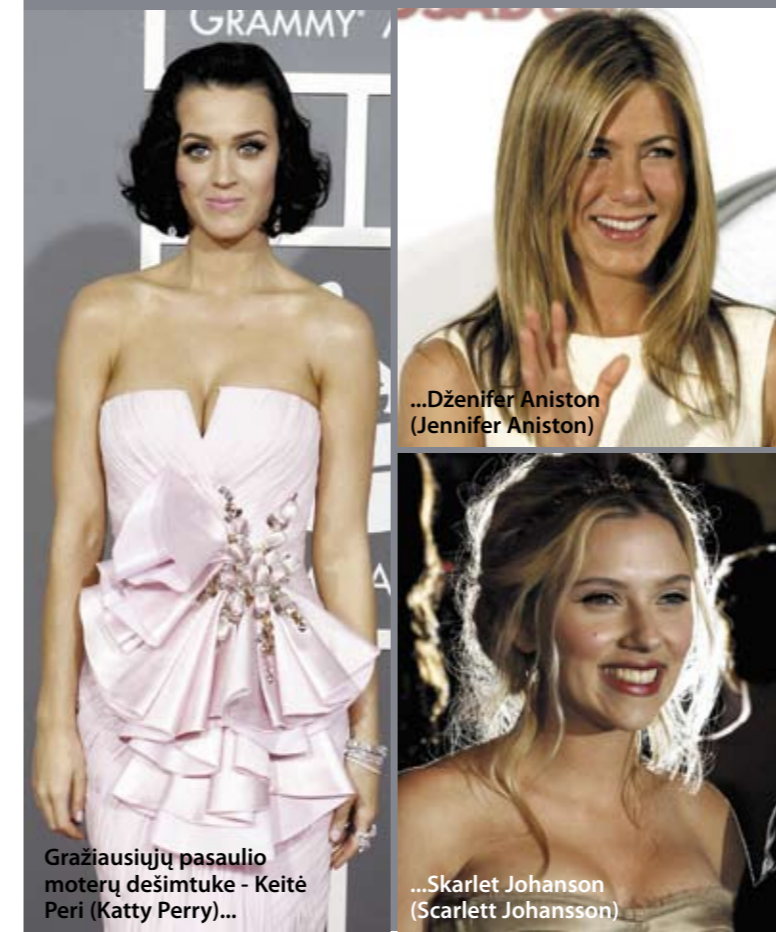
Gražiausiųjų pasaulio moterų dešimtuke - Keitė Peri (Katy Perry)...

Gražiausiu pasaulio vyrų išrinktas Čaningas Tatumas (Channing Tatum).