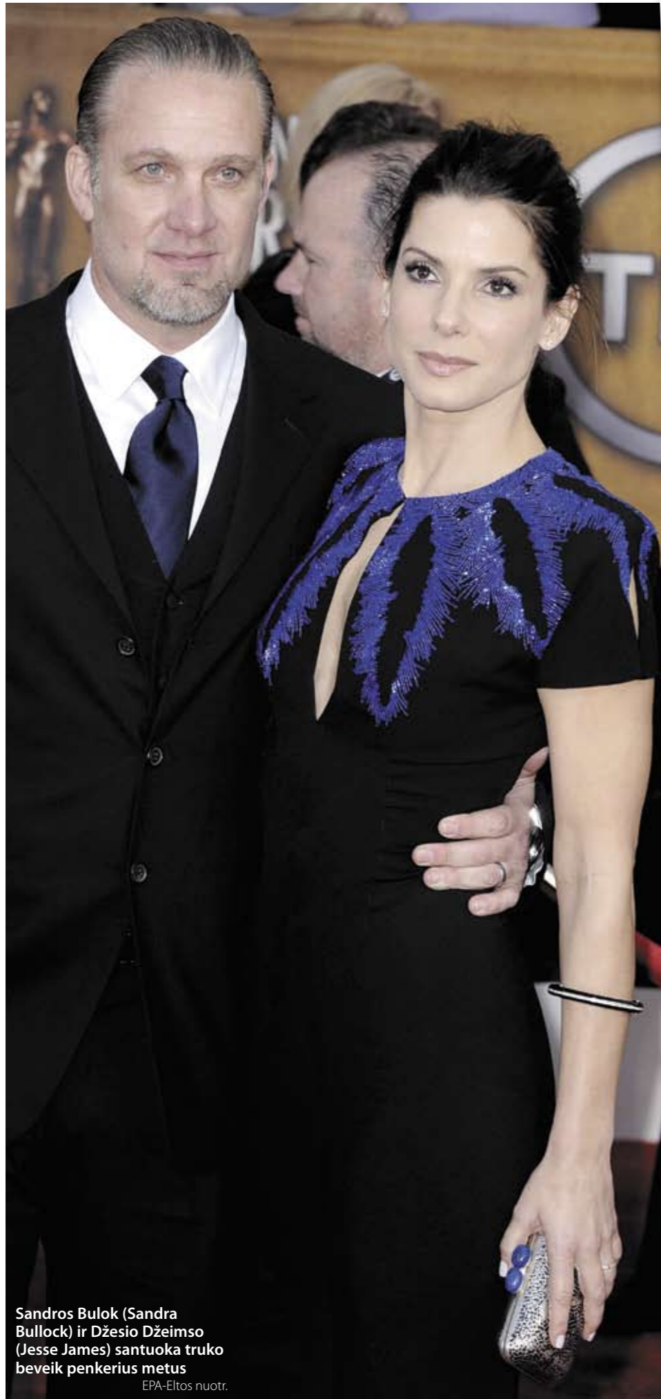
Sandros Bulok (Sandra Bullock) ir Džesio Džeimso (Jesse James) santuoka truko beveik penkerius metus.