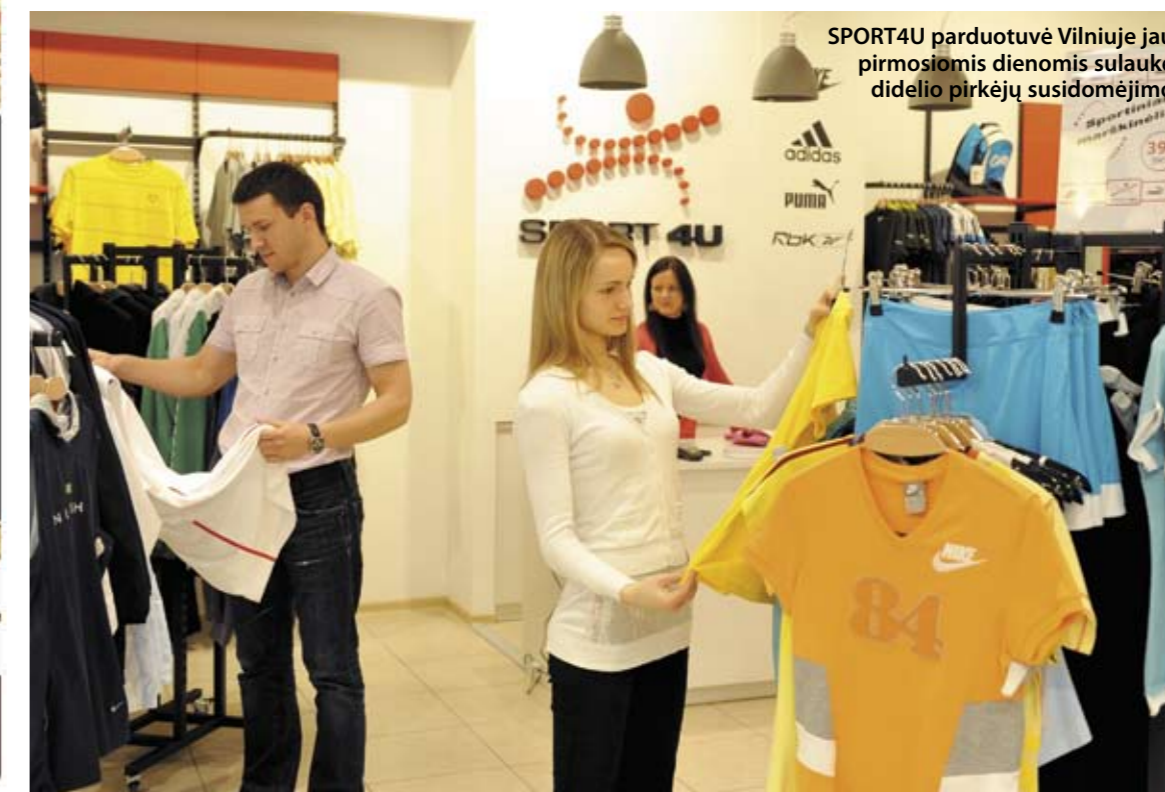
SPORT4U parduotuvė Vilniuje jau pirmosiomis dienomis sulaukė didelio perkėjų susidomėjimo

pavasario sezonui skirti drabužiai, bet ir viliojančios kainos. Atidarymo proga "Nike", "Adidas", "Puma", "Reebok" marškinėlius čia galima įsigyti už 39 litus, o bluzonų ir pavasariinių striukių kaina - nuo 59 litų. Ir tai dar ne viskas! Gegužės mėnesį visiems, turintiems "Laisvalaikio" kortelės, taikoma papildoma 12 procentų nuolaida ne tik naujoms kolekcijoms, bet ir akcijų prekėms. O kas sakė, kad nuolaidos nesumuojamos? "Laisvalaikio" klubo kortelė turėtojoms tokia galimybė - garantuota! Užsukite į mūsų parduotuvę ir pasinaudokite puikia proga kokybišką laisvalaikio ir sporto prekių įsigyti gerokai pigiau! ■ KAS? Nauja SPORT4U parduotuvė ■ KUR? PC "Mandarinas" Ateities g.91, Vilnius ■ KODĖL? Nes čia stilinga ir kokybiška sporto ir laisvalaikio apranga kainuoja pigiau "Laisvalaikio" inf.