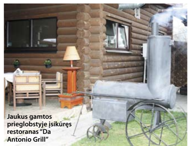
Jaukus gamtos prieglobstyje įsikūręs restoranas "Da Antonio Grill"