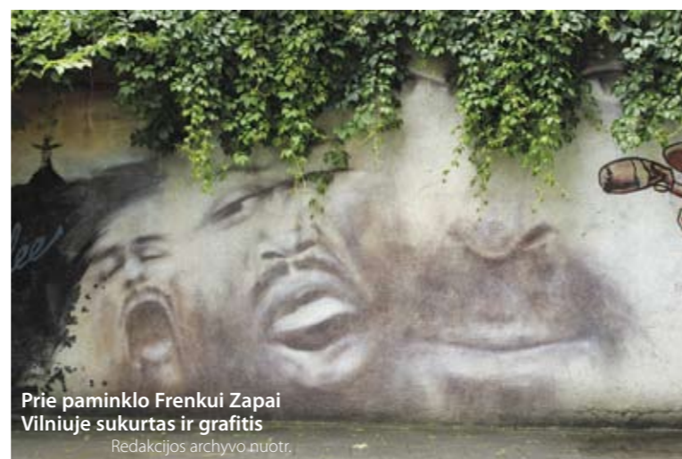
Prie paminklo Frenkui Zapai Vilniuje sukurtas ir grafitis.