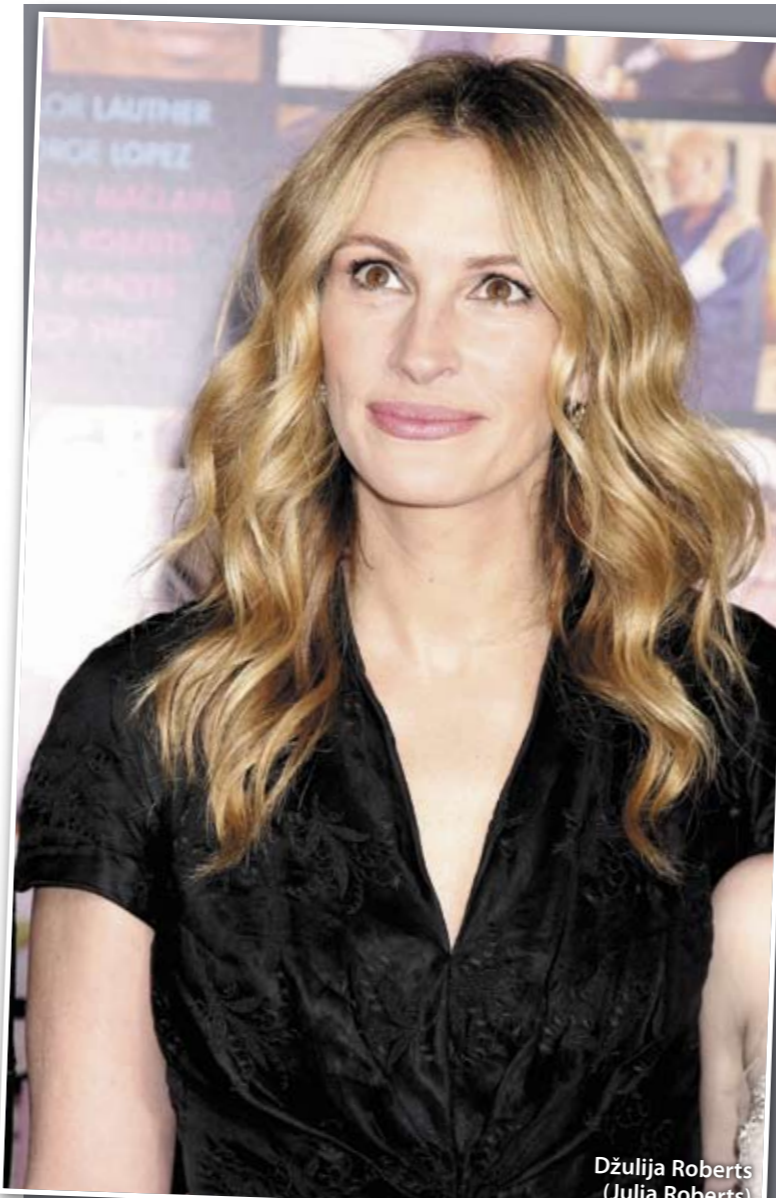
Džulija Roberts (Julia Roberts)