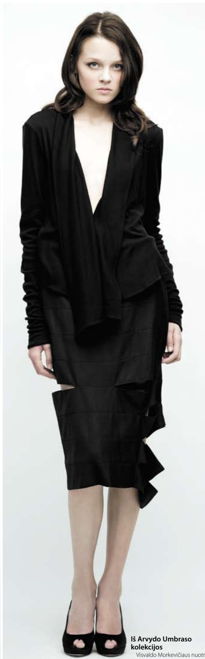
Iš Arvydo Umbrasos kolekcijos Visvaldo Morkevičiaus nuotr.