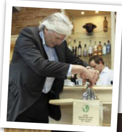
Pirmojo šių metų arbatos derliaus dėžė atskraidinta tiesiai iš tolimosios Indijos aukštikalnių