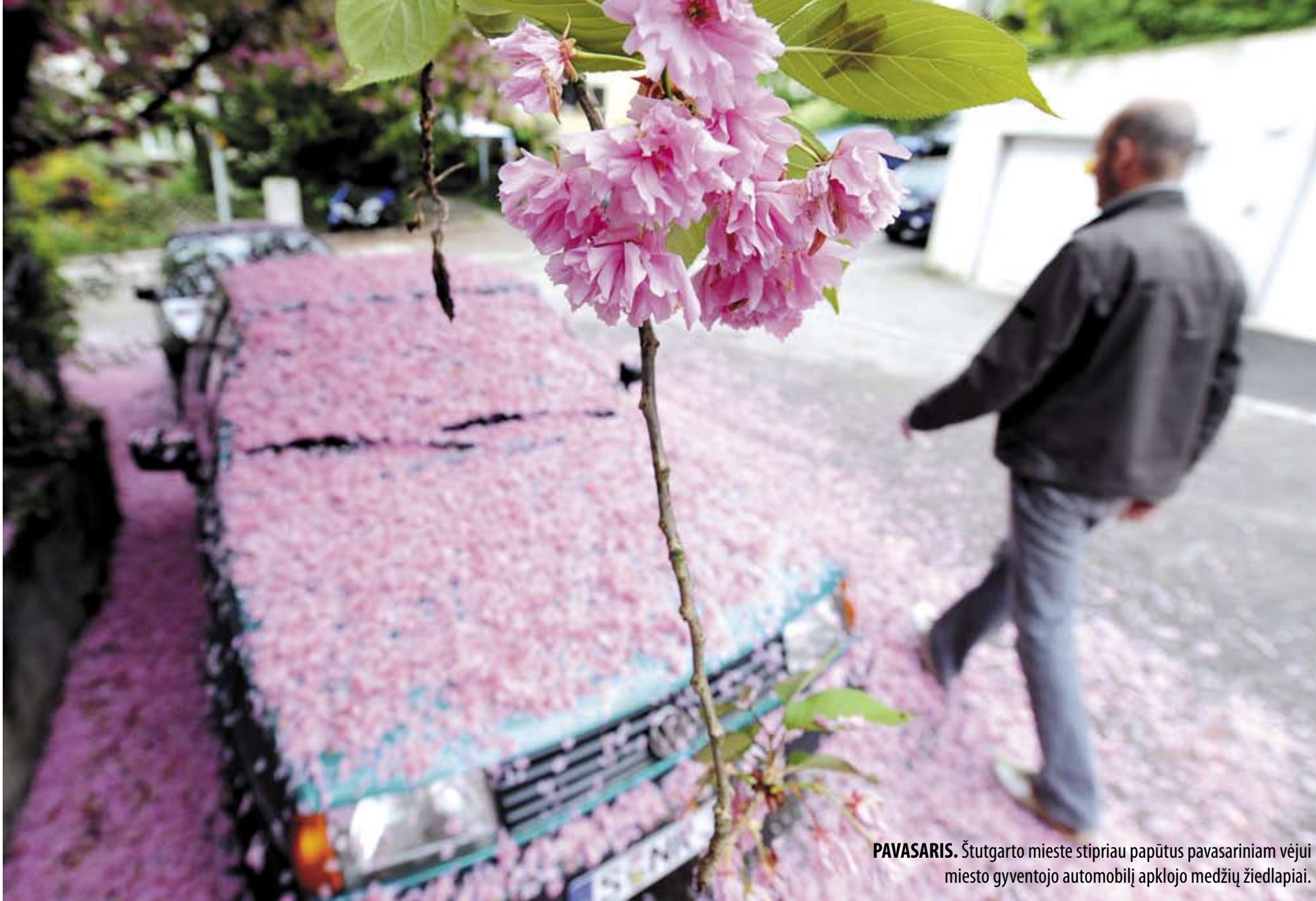
PAVASARIS. Štutgarto mieste stipriau papūtus pavasariniam vėjui miesto gyventojų automobilį apklojo medžių žiedlapiai.