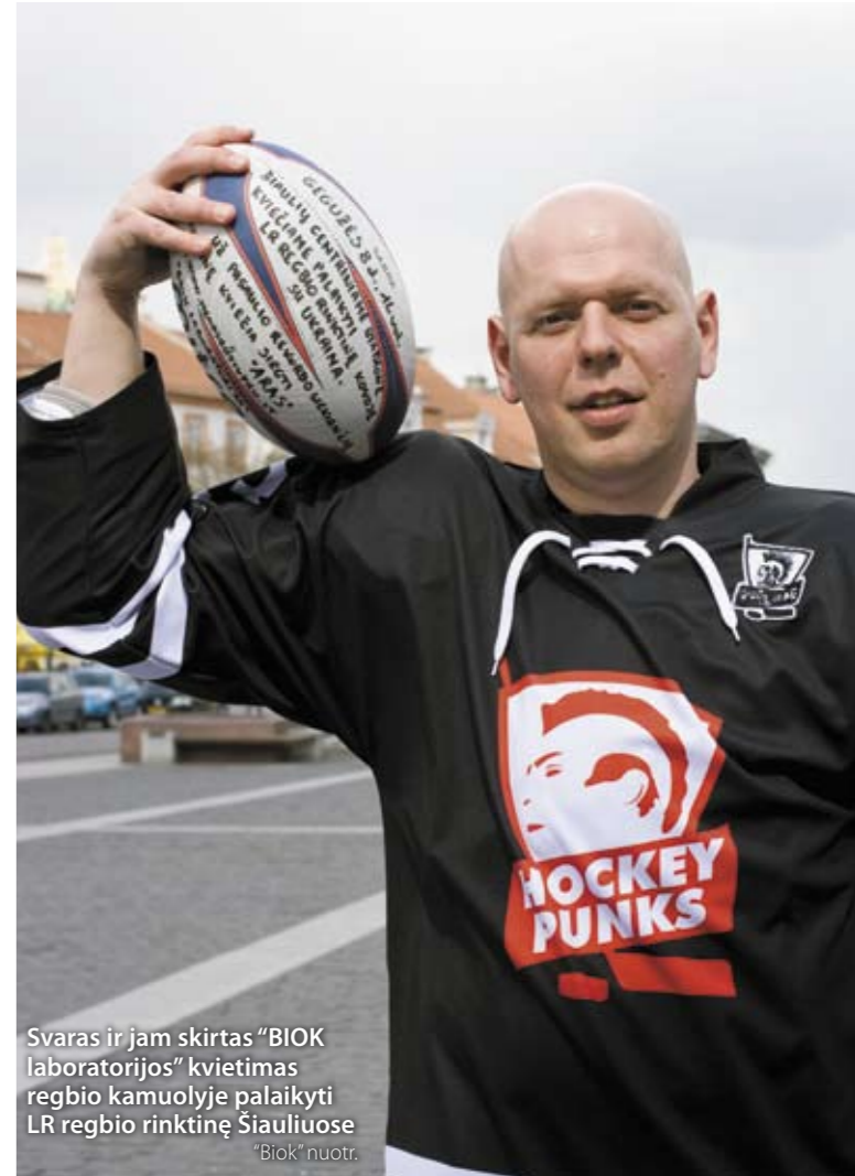
Svaras ir jam skirtas "BIOK laboratorijos" kvietimas regbio kamuolyje palaikyti LR regbio rinktinę Šiauliuose