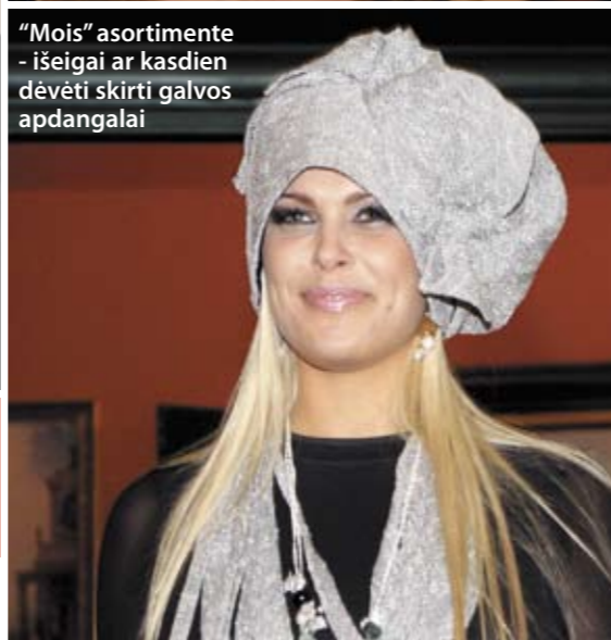
"Mois" asortimente - išėigai ar kasdien dėvėti skirti galvos apdangalai