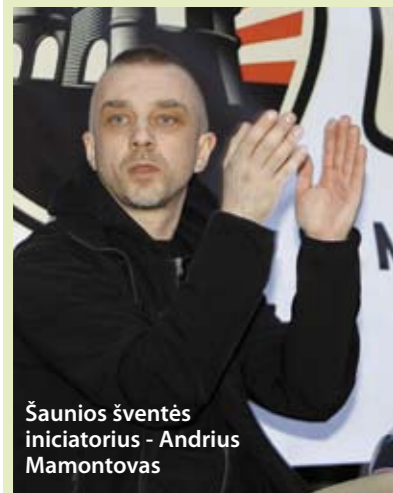
Šaunios šventės iniciatorius - Andrius Mamontovas

Jau ketvirtą kartą Lietuvos miestuose ir miesteliuose šurmuliavo Gatvės muzikos diena. Žavinti muzikos instrumentų įvairove ir įvairiausiais stiliais. Muzikavo ne tik žinomi scenos žmonės, bet ir praeiviai.