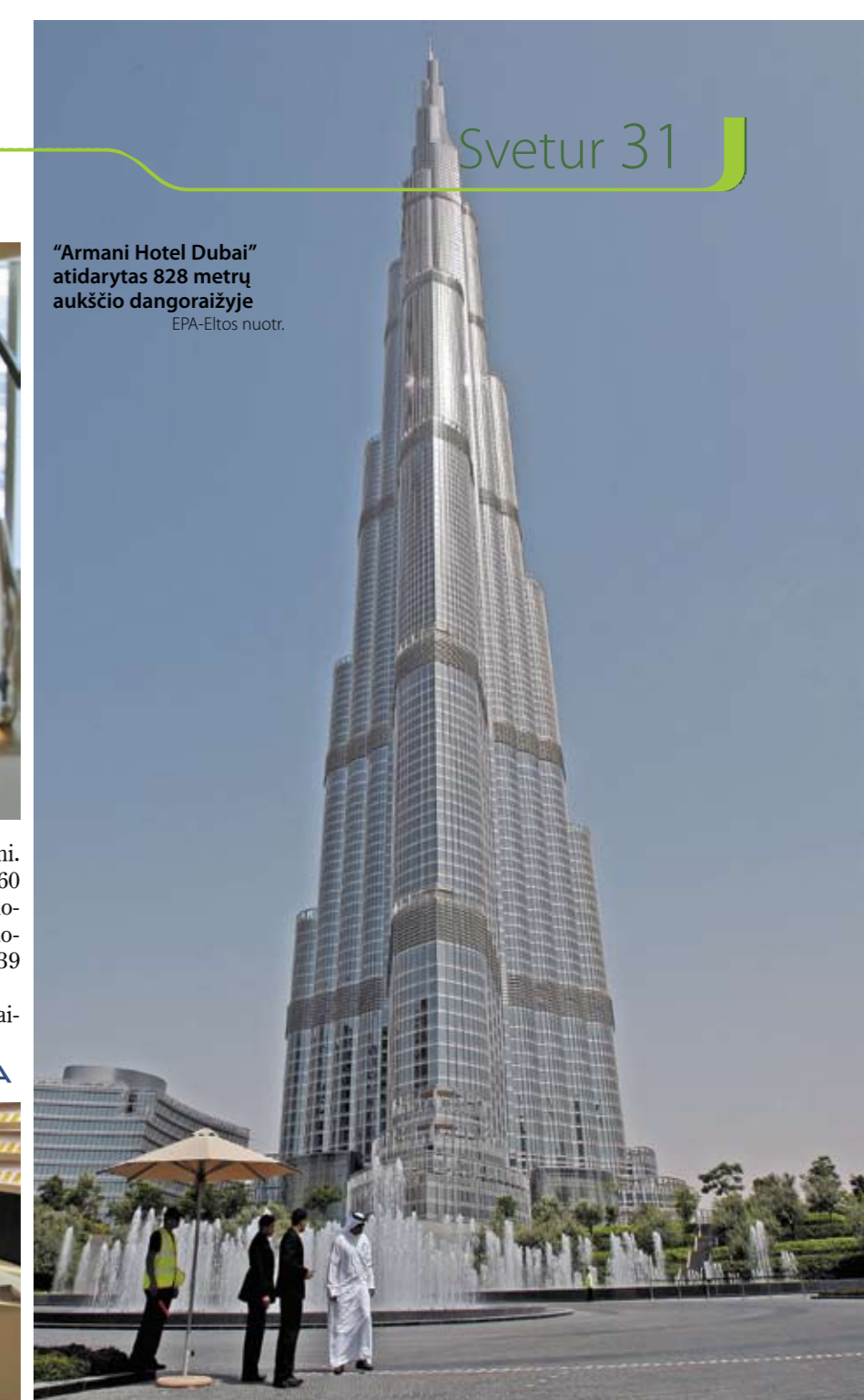
"Armani Hotel Dubai" atidarytas 828 metrų aukščio dangoraižyje