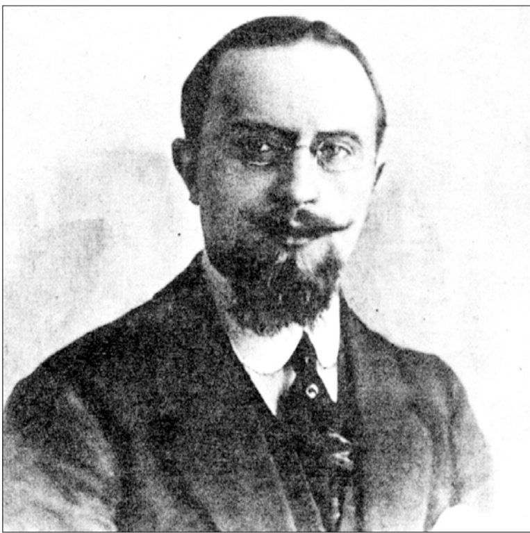
► Kazys Bizauskas (1892-1941 m.)

K.Bizauskas gimė 1893 m. vasario 2 d. (pagal tuometį senąjį kalendorių, pagal naująjį - vasario 15 d.). Kituose šaltiniuose nurodoma 1892 m. Gimimo vieta tikriausiai buvo Paviluosta (lietuviškai Povilo Uostas, rusiškai - Pavlovo) Kuldigos apskrityje Latvijoje. Sovietinės lietuviškosios enciklopedijos, Bostone išleisti „Lietuvių enciklopedija“ ir kai kurie kiti šaltiniai nurodo jo gimtinę buvus