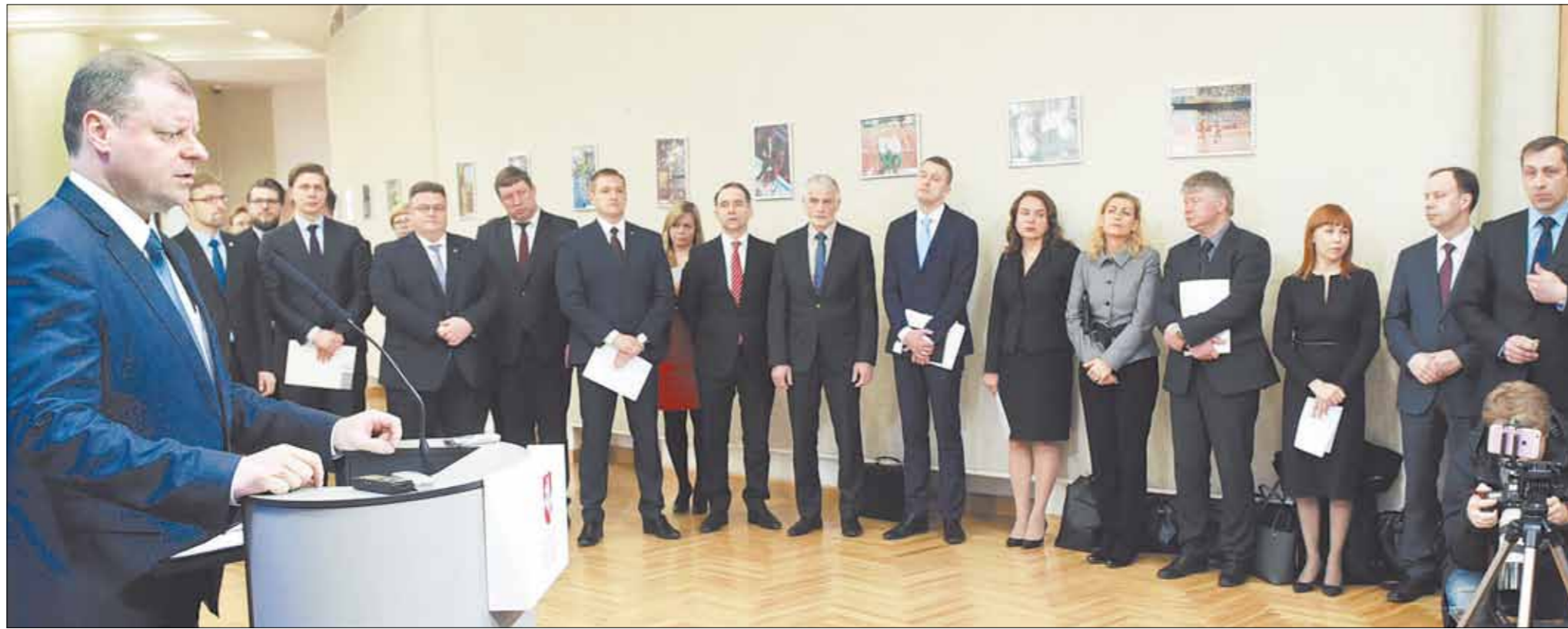
Šeimo Jūrnio nuotr.

O tos mokestinės pertvarkos, kurias pasiūlė Vyriausybė, švelniaiariant, yra labai neambicingi pasiūlymai, kurie tik šiek tiek kosmetiškai aptvarko tą mūsų sistemą, tačiau nekuria naujų šaltinių didesnėms pajamoms į valstybės biudžetą ir nesudaro galimybių didinti persikirstymą. Man nesuprantamas Vyriausybės dvejojimas ir per daug atsargus trypčiojimas vienoje, nes mokesčių sistema iš tiesų reikėjo sutvarkyti. Dėl šešėlinės ekonomikos yra pateikti tokie minimalūs pasiūlymai, tad labai abejoju, ar jie padės ištraukti pajamų iš šešėlio. O be pajamų mes negalėsime tesėti dosnių pažadų. O kas bus 2019 metais? Ar bus toks ūkio augimas, kad galėtume įgyvendinti įsipareigojimus didinti pensijas, socialines išmokas. Mano manymu, labai blogai, kad mes įsaldėme viso viešojo sektoriaus atlyginimus, todėl ir mokytojai, ir socialiniai darbuotojai, ir ugniagesiai, ir kultūros darbuotojai vegetuoja ant to slenkščio, kuris yra tarp skurdo ir tarp normalaus egzistavimo.