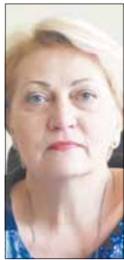
Rasa BUDBERGYTĖ Seimo narė

sprendimus. Paprastai žmonės taip ir daro, nejuokauja ir neskuaba su tokiais dalykais. Šiuo atveju paskubėta gal dėl nesupratimo, gal dėl jaunumo, gal dėl socialinės patirties trūkumo.