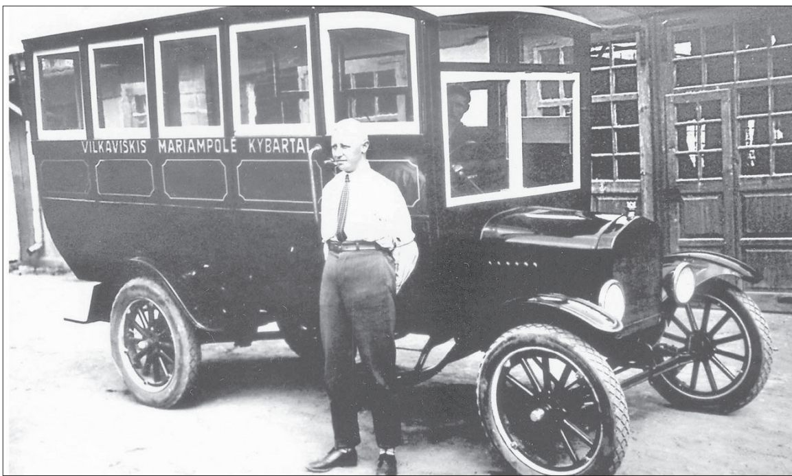
► Vienas iš pirmųjų (gal ir pirmas) lietuviškas autobusas su „Ford“ šasi „Amlito“ dirbtuvių kieme