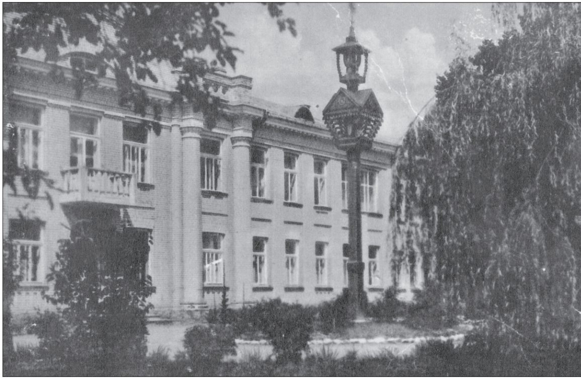
► Panevėžio vidurinės amatų mokyklos moksleivių padarytas stogastulpis. Apie 1940 m.