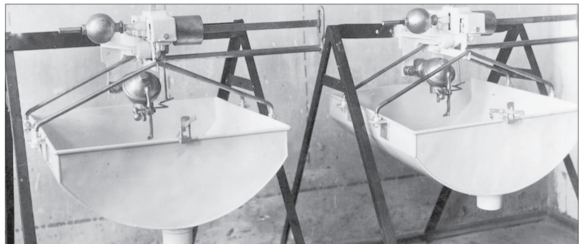
► Panevėžio vidurinės amatų mokyklos moksleivių pagamintos svarstyklės