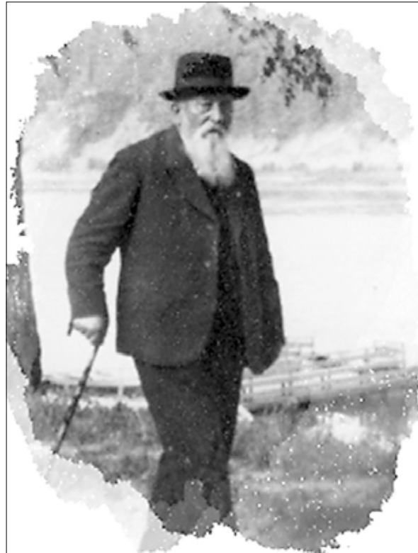
► Martynas Jankus (1858-1946)

apšvietos lygmeniu mažlietuvių pranoko savo tautiečius Didžiojoje Lietuvoje; skirtingos buvo ir religinės konfesijos.