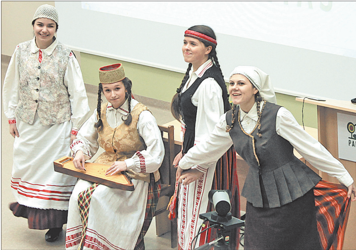
► Jaunimas į kaimą kol kas grįžta tik su dainomis

Gyvenimą kaime daug kas supranta tik kaip žemės dirbimą. Nebūtinai. Ne vien ūkininkavimas yra kaimo ekonomikos variklis. Kaimiškose vietovėse yra didelės galimybės užsiimti verslu kaip ir miestuose, bet kol kas jomis nepasinaudojama. Turime tinkamų žaliavų gaminti tradicinius ir novatoriškus gaminius iš medienos, baldus, rąstinius namus, statybines konstrukcijas, maisto produktus, turinčius vis didesnę paklausą visame pasaulyje. Kaime daug kur yra spartusis internetas. Niekur kitur Europoje to nėra. Kadangi visos technologijos sukurtos, galima dirbti nuotoliniu būdu. Kalbu čia apie aukštąsias technologijas, ku-