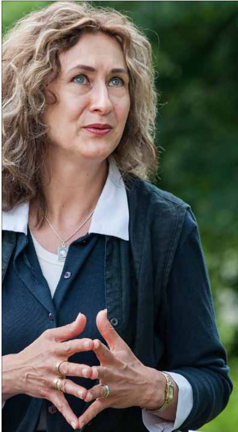
Kazimiero Linkevičiaus nuotr.

- Kyla įvairių minčių. Iš tiesų mums teko labai sudėtingas laikas ir sunku jį vertinti. Mūsų lūkesčiai buvo vienokie, o dabar jie gali atrodyti visai kitokie. Tik vieną dalyką galiu pasakyti. Man gyventi dabar daug kartų geriau. Prisimenu baimės jausmą jaunystėje, kai negalėjai laisvai kalbėti. Nežinojome, kada ir ką galima sakyti. Laisvos minties nebuvo jokios. Dabar tai turime, bet matote, kas atsitiko. Daug kas pamiršo, kad yra ne tik laisvė, bet yra ir pareigos, kurių reikia laikytis. Pamiršome žmoniškumo kriterijus. Pamynėme vertybes, nes kiti dalykai atsirado. Dir-