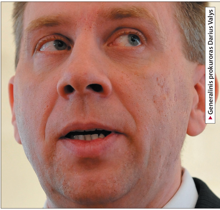
Generalinis prokuroras Darius Valys