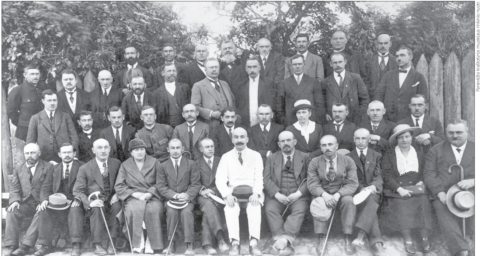
► Pirmoji Panevėžio miesto savivaldybės taryba