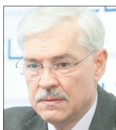
Zigmantas BALČYTIS Europarlamentaras

► Mes visi kartu šiandien turime mėginti sutelkti intelekto, gamybos potencialą, galbūt ir pinigus