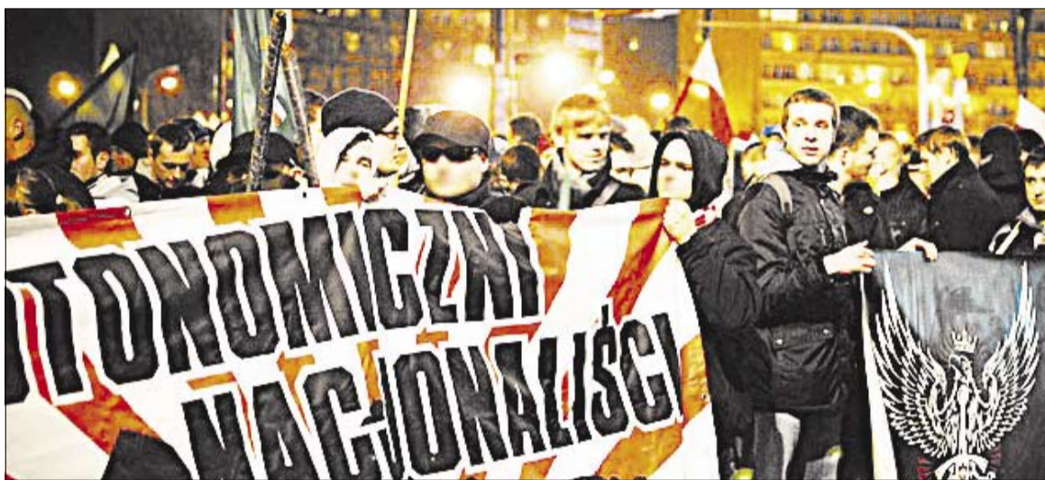
► BENDRUMAS. Kovo 11-osios eitynės Vilniuje (nuotrauka viršuje) ir lapkričio 11-osios Varšuvoje turi tą patį tikslą: išsaugoti lietuvių ir lenkų tautų tapatybę vis labiau jas niveliuojančioje ES