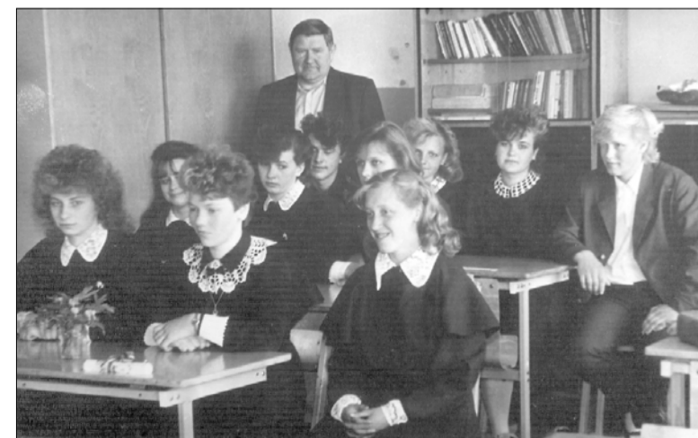
► MOKYKLA. 37 metus pedagogas atidavė Panočių vidurinei mokyklai