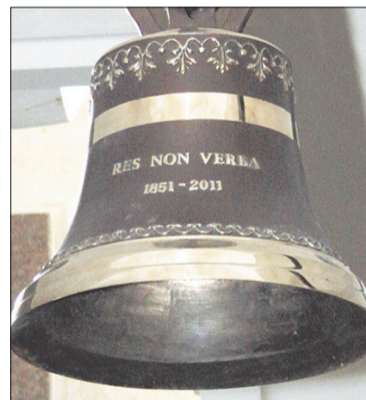
► VARPAS. J. Janonio gimnazijoje, minint 160 metų sukaktį, pakabintas varpas. Juo pirmą kartą bus paskambinta šeštadienį

Man labai rūpi Lietuvos ateitis, valstybės ir laisvų bei atsakingų žmonių bendruomenės ateitis.