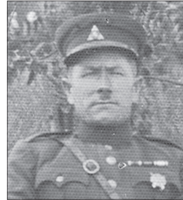
► Perlojos Respublikos vadas Juozas Lukoševičius