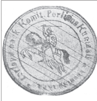
► Perlojos Respublikos antspaudas