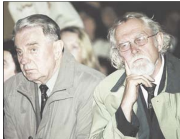
► Su poetu Justinu Marcinkevičiumi

šimtmečiuose žinomo rašytojo knygų, bet ir klasikos: Donelaičio, Daukanto, Baranausko, Maironio, Krėvės ir kt. Patekus į knygyną, man kartais atrodo, kad jau praradome savo istorinę atmintį, lyg vaikščiotume po kokius Frankfurto, Niujorko knygynus. Mūsų vaikiai jau nemato klasikos knygų, buvusių kūrėjų pavardės dažniausiai jiems reiškia tik gatvių pavadinimus.