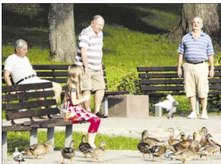
➤ DRUSKININKAI. Žydai sugrįžta, antys neišskrenda - viskas gerai!

- Gal, sakau, daktare, jau galima - paprasčiausiai skaitytiniai