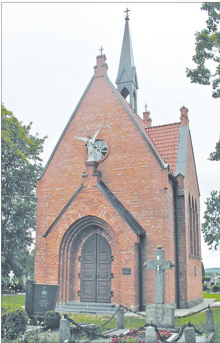
► Rašytojos Šatrijos Raganos koplyčia Židikų kapinėse, Mžeikių r.

► Šiandien Marija Pečkauskaitė-Šatrijos Ragana savo krikščioniška meile liudija dvasinę šviesą ir šilumą, kurios mums vis dar trūksta