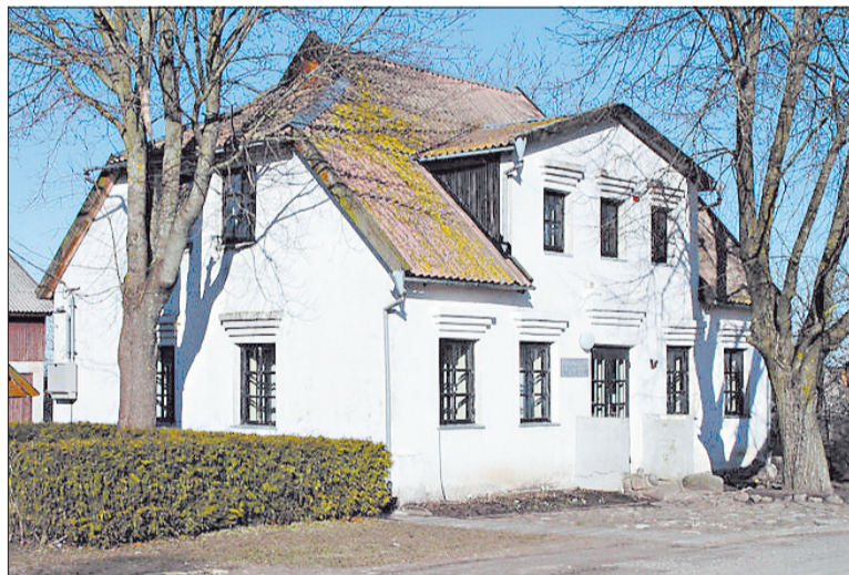
► Rašytojos Šatrijos Raganos memorialinis muziejus Židikų kaime

žodžiais, o darbais. Aukštino veiklius, išstvermingus, sumanius, kitiems padedančius ir pasiaukojančius personažus.