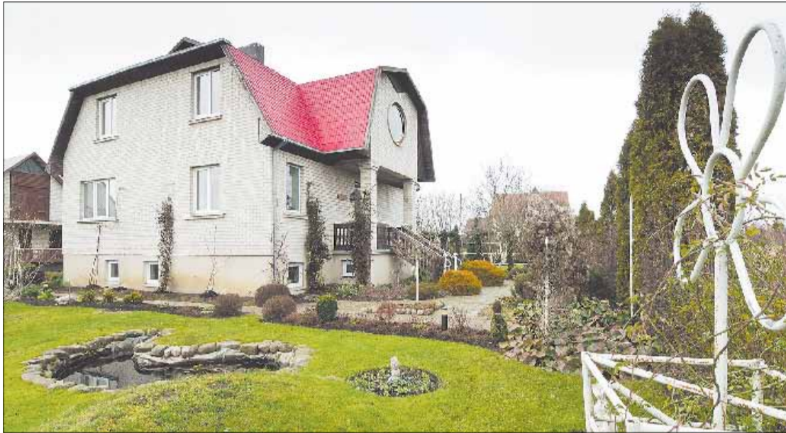
► LAUKIMAS. Marijampoliečių Ferencų sodybos augalai brandina žiedus pavasario žydėjimui, o pati sodyba net ir žiemą skęsta žalumoje

Panašiu keliu iš Anglijos parke liavo lauravyšnės, aukštaūgės vijoklinės rožės, dar kiti augalai, kurių ir pavadinimų net nežino. „Renku tik sėklas arba iškasu mažą atžalėlę, nusilaužiu šakelę, niekam dėl to nėra skriaudos“, - sako vyras. Pasakoja kartą nustebinęs būrelį britų, iš tolo stebėjusių, ko tas užsienietis po gyvatvore kapstosi. Anglijoje gyvatvorėms naudojama lauravyšnė Lietuvoje užaugo mažesnė, bet kiti Britanijoje gyvatvorėms auginami medeliai ne tokie lepūs. Iš išleistų atžalų pati rožių pasidaugino. Ji niekada nepurenanti žemės neapžiūrėjusi, ar koks nors naujas augalėlis neišdygo. Augalus mylinčiai šeimninkei ir paukščiai sėklų pabarsto.