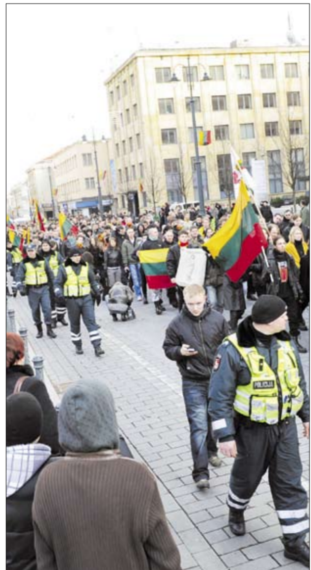
▶ DEMOKRATIJA. Lietuvių tautinio centro rengiamose Kovo 11-osios eitynėse Vilniaus centre jaunimo patriotiškumas, pasirodo, labai pavojingas. Dėl to, kad jauni žmonės dar didžiujasi esą lietuviai, o ne europiečiai!