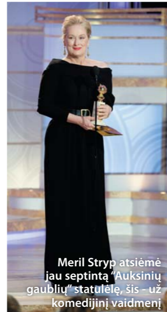
Meril Stryp atsiėmė jau septintą "Auksinių gaublių" statulėlę, šis – už komedijinį vaidmenį