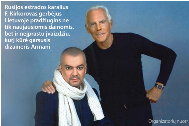
Rusijos estrados karalius F. Kirkorovas gerbėjus Lietuvoje pradžiugins ne tik naujaisiais dainomis, bet ir neįprastu įvaizdžiu, kurį kūrė garsusis dizaineris Armani