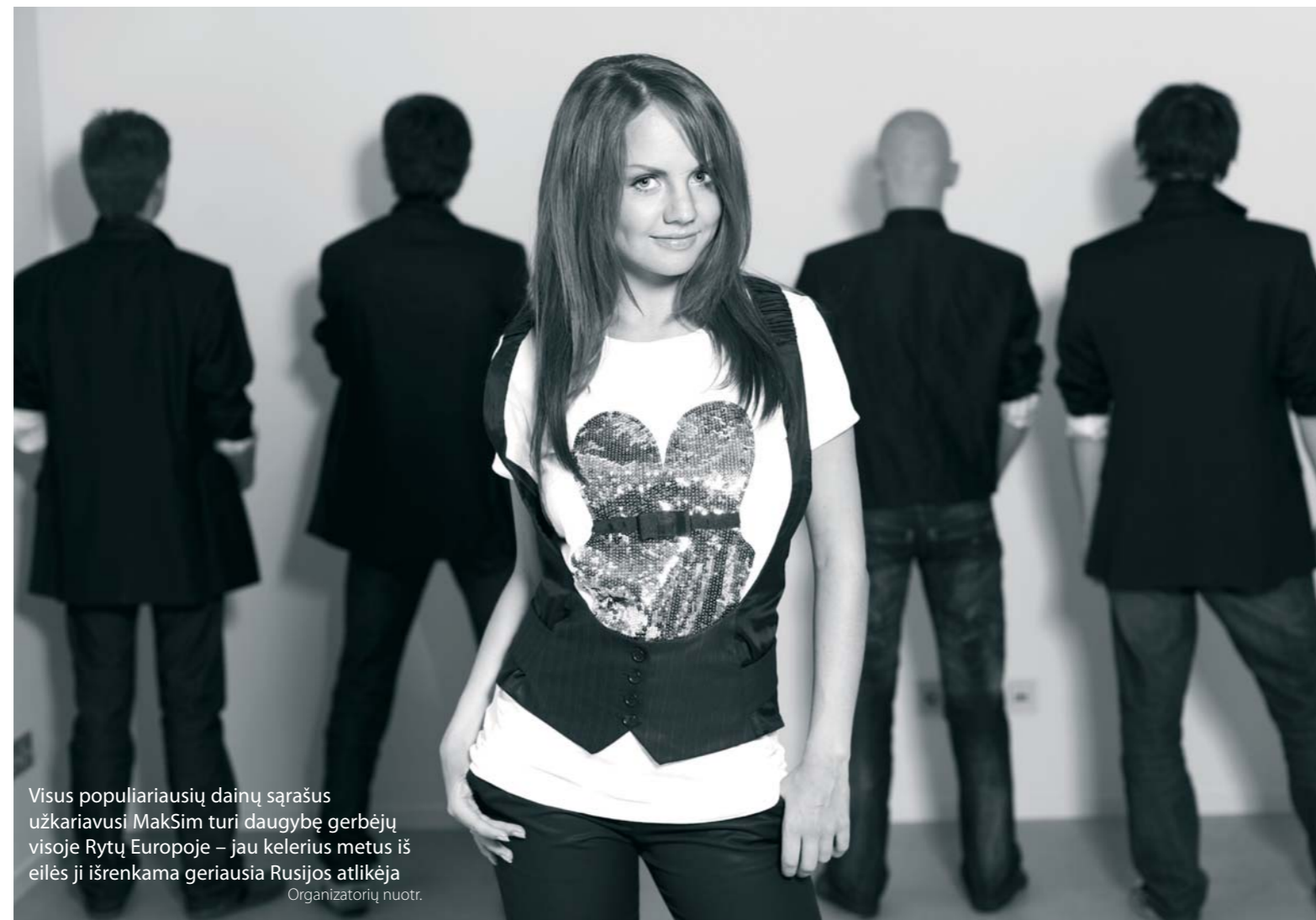
Visus populiariausių dainų sąrašus užkariavusi MakSim turi daugybę gerbėjų visoje Rytų Europoje – jau kelerius metus iš eilės ji išrenkama geriausia Rusijos atlikėja

Pati atlikėja MakSim džiaugiasi, kad dalyvauti jos garbei rengiamuose grožio rinkimuose panorą tiek