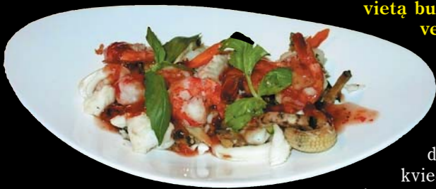
...ir būtina pajėgti įveikti jau paruoštą patiekalą

Dėmesio mėgstantiems socialiai pavalgyti! Šį šeštadienį, sausio 23 d., Vilniaus “Verslo uoste” (Lvovo g.25) įsikūrusiame “Wall St” restorane vyks valgymo konkursas “Besotis”. Renginio laikas - nuo 13 val. iki 15 val. Konkurso rungtis - susidėti į dubenėlį kuo aukštesnį maisto kalną ir jį suvalgyti. Dalyviai savo patiekalą galės sukurti iš 50 ingredientų: įvairios mėsos, jūros gėrybių, daržovių. Konkurso nugalėtojai bus apdovanoti prizais: pirmos vietos laimėtojas - 200 litų restorano “Wall St” dovanų čekiu, antros - 100 litų dovanų čekiu, o pelniusiajam trečiają vietą bus įteiktas 50 litų vertės dovanų čekis.