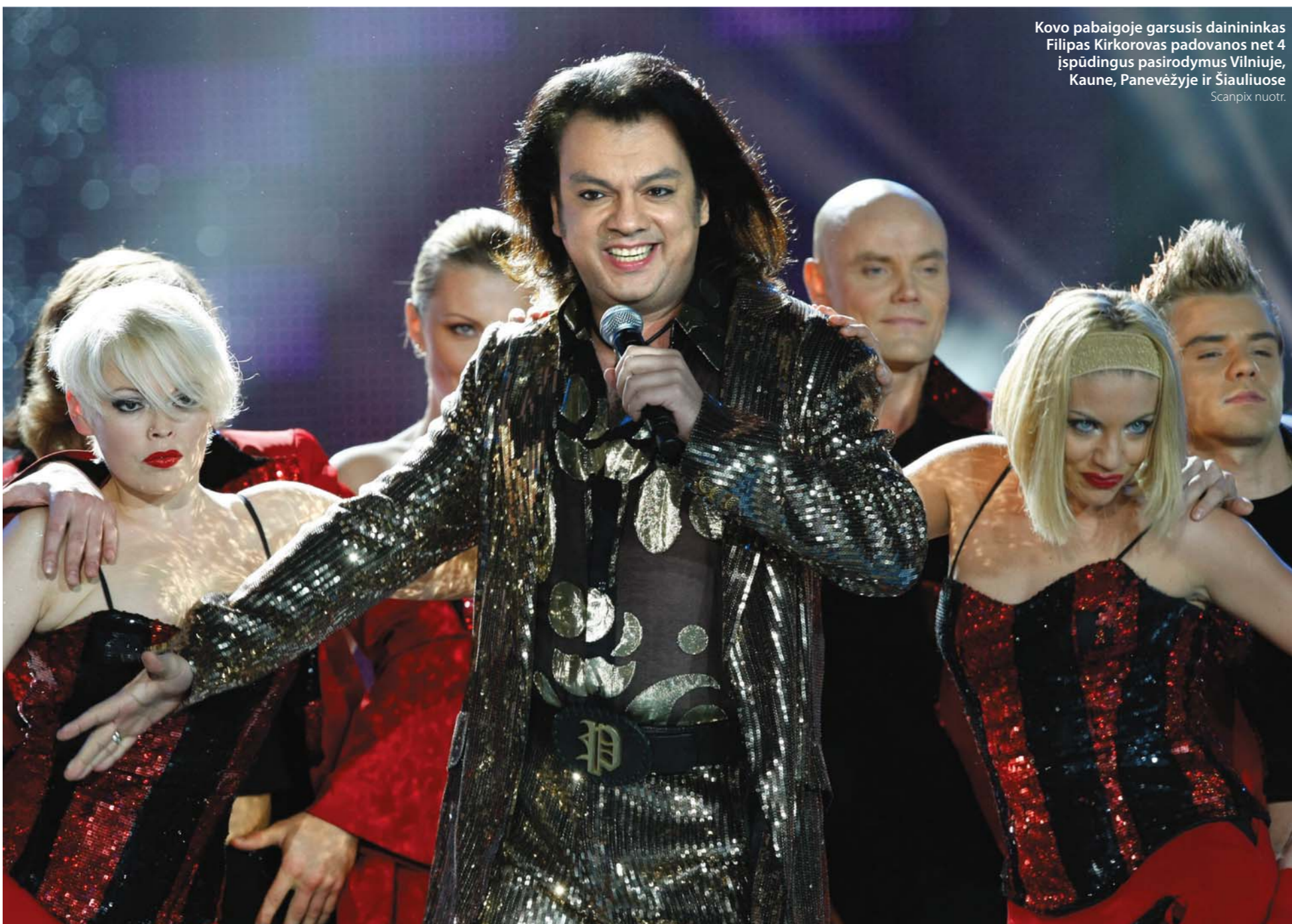
Kovo pabaigoje garsusis dainininkas Filipas Kirkorovas padovanos net 4 įspūdingus pasirodymus Vilniuje, Kaune, Panevėžyje ir Šiauliuose.