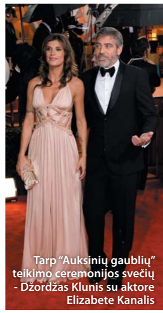
Tarp "Auksinių gaublių" teikimo ceremonijos svečių - Džordžas Klunis su aktore Elizabete Kanalis