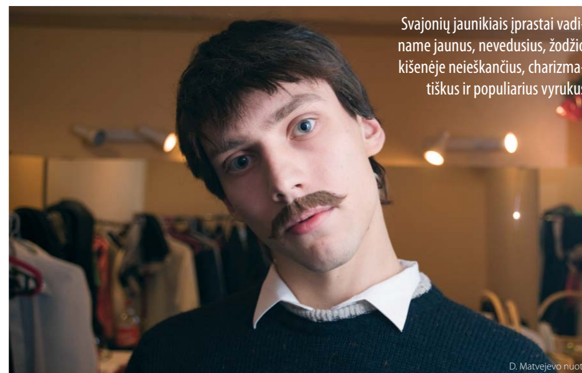
Svajonių jaunikiais įprastai vadiname jaunas, nevedusius, žodžio kišenėje neieškančius, charizmatiškus ir populiarius vyrus