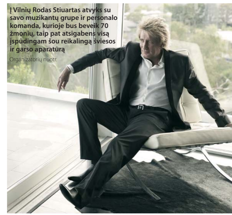
Į Vilnių Rodas Stiuartas atvyks su savo muzikantų grupe ir personalo komanda, kurioje bus beveik 70 žmonių, taip pat atsigabens visą įspūdingam šou reikalingą šviesos ir garso aparatūrą