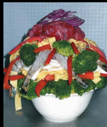
Svarbiausia - susikrauti kuo aukštesnį maisto kalną...