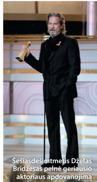
Šešiasdešimtmetis Džefas Bridžesas pelnė geriausio aktorius apdovanojimą