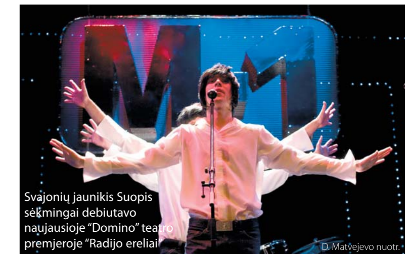
Svajonių jaunikis Suopis sėkmingai debiutavo naujiausioje „Domino“ teatro premjeroje „Radijo ereliai“