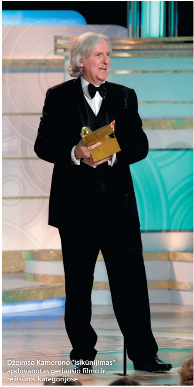
Džeimso Kamerono "Isikūnijimas" apdovanojimas geriausio filmo ir režisūros kategorijose