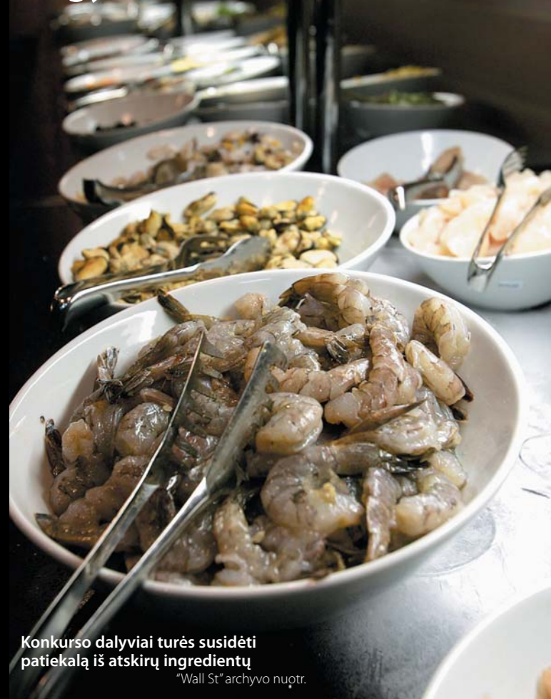
Konkurso dalyviai turės susidėti patiekalą iš atskirų ingredientų