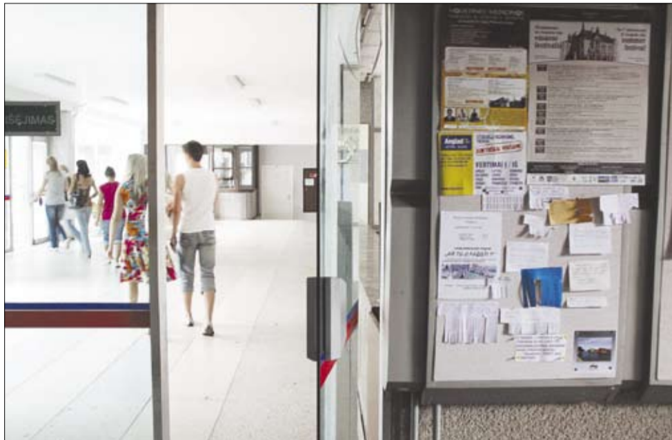
► SKELBIMAI. Universitetų skelbimų lentos mirga nuo butų nuomos pasiūlymų, tačiau ne visi studentai randa iš ko rinktis

Į aukštąsias mokyklas šiemet įstoję pirmakursiai bei aukštesnių kursų studentai jau sukruoto ieškoti nuomojamų butų. Visi universitetai, akademijos turi bendrabučius, tačiau retame jų atvykusiems iš kitų miestų ar rajonų jaunuoliams užtenka vietų. Išėjus - nuomotis.