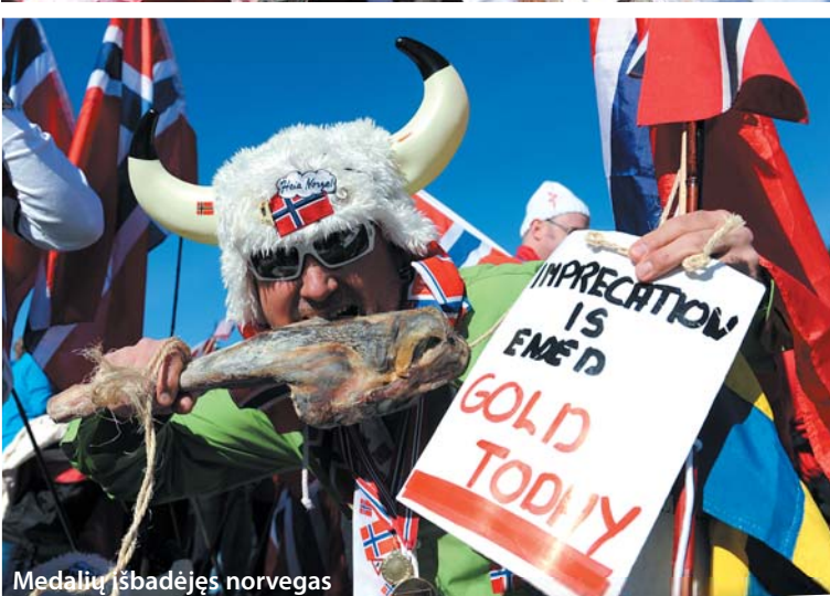
Medalių išbadėjęs norvegas