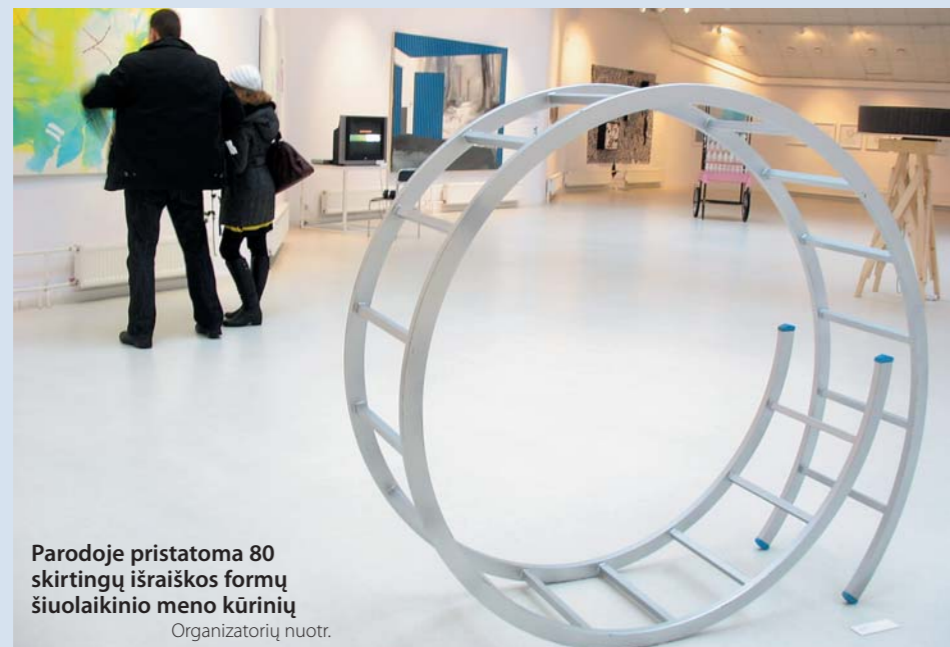
Parodoje pristatoma 80 skirtingų išraiškos formų šiuolaikinio meno kūrinių

Kiekvienoje šalyje menotyrininkų ir kuratorių komandos atranka po 10 perspektyvių