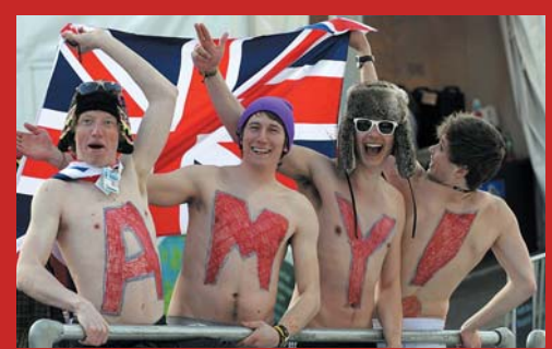
Apsiginklavę ir įkaitę britai