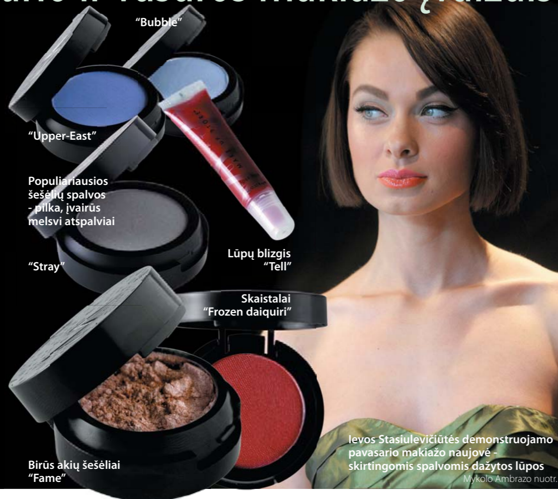
"Bubble" "Upper-East" Populiariausios šešėlių spalvos - pilka, įvairūs melsvi atspalviai "Stray" Lūpų blizgis "Tell" Skaistalai "Frozen daiquiri" Birūs akių šešėliai "Fame"