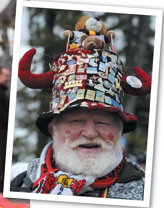
Vokiečiai pasirūpino atributika