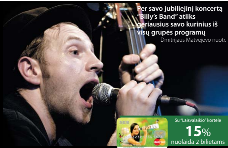
Per savo jubilėjinį koncertą "Billy's Band" atliks geriausias savo kūrinius iš visų grupės programų