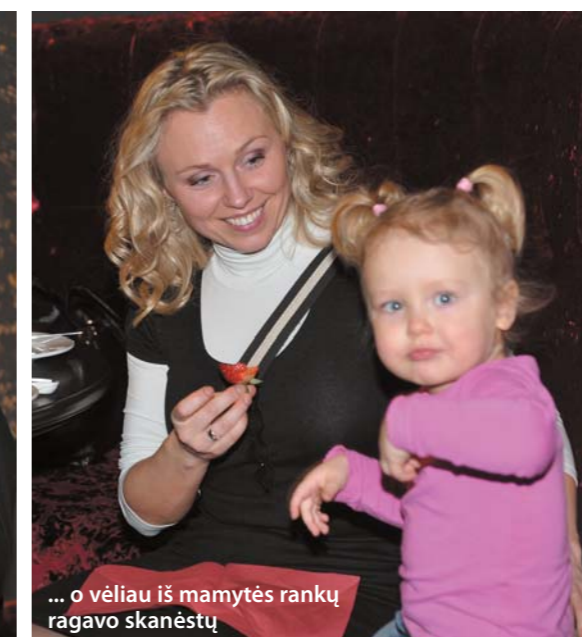
...o vėliau iš mamytės rankų ragavo skanėstų