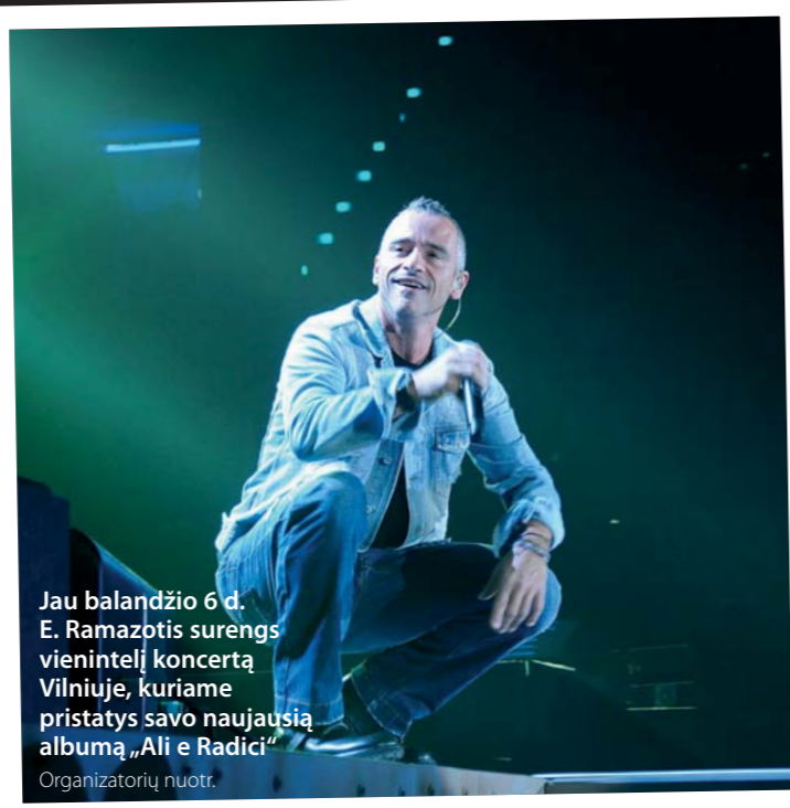
Jau balandžio 6 d. E. Ramazotis surengs vienintelį koncertą Vilniuje, kuriame pristatys savo naują albumą „Ali e Radici“

Vasario 13-tą surengęs įspūdingą pasirodymą Ispanijos sostinėje Madride garsusis atlikėjas Erosas Ramazotis tęsia savo gastroles ir grandioziniais šou drebindamas didžiausius Europos miestus artėja prie Lietuvos. Jau balandžio 6 d. dainininkas surengs vienintelį koncertą Vilniuje, kuriame pristatys naują albumą „Ali e Radici“. Specialiai ištikimiausiems savo gerbėjams legendinis atlikėjas taip pat dovanoja dainų rinkinį „The Collection“, į kurį įtraukė geriausias per visą savo karjerą sukurtus hitus.