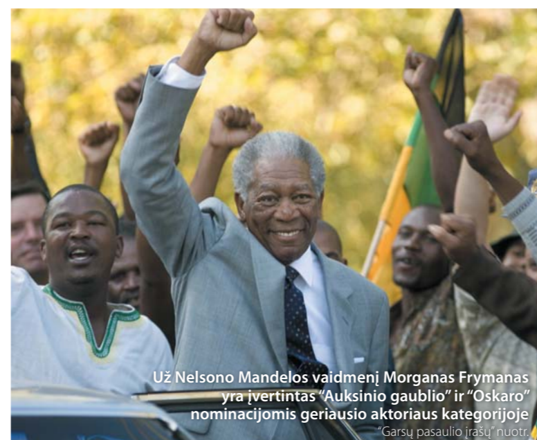
Už Nelsono Mandelos vaidmenį Morganas Frymanas yra įvertintas "Aukšinio gaublio" ir "Oskaro" nominacijomis geriausio aktorius kategorijoje