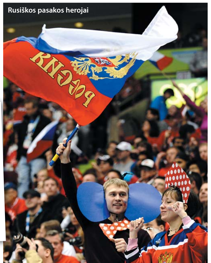
Rusiškos pasakos herojai