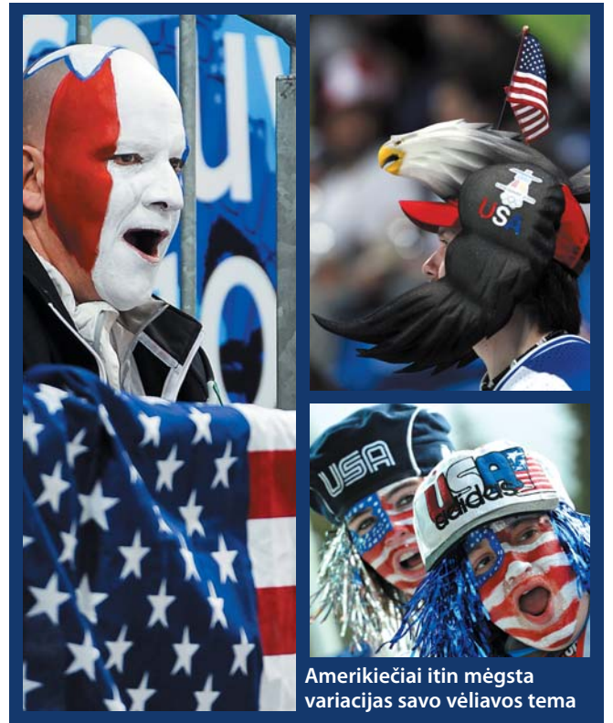
Amerikiečiai itin mėgsta variacijas savo vėliavos tema