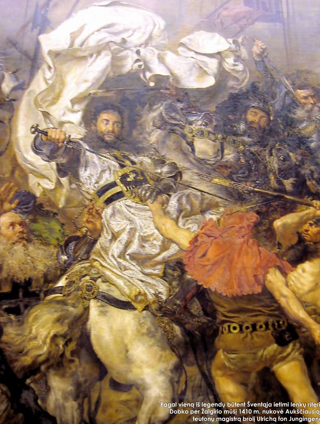
Pagal vieną iš legendų būtent Šventąją ietimi lenkų riteris Dobko per Žalgirio mūšį 1410 m. nukovė Aukščiausiąjį teutonų magistrą brolių Ulrichą fon Jungingą.

Žlugus Trečiajam reichui A. Hitleris bandė paslėpti ietį. Išliko dokumentai, patvirtinantys, kad jis kartu su kitais lobiais liepė išsiųsti relikviją į Antarktidą povandeniniu laivu. Tačiau įvykdyti šio įsakymo fašistai nespėjo. Pagal vieną iš versijų Likimo ietį 1946 m. viename iš Niurnbergo šulinių surado amerikiečiai. Sužinojęs apie radinį čia keičiausias JAV generolas Džordžas Patonas (George Smith Patton, Jr.). Tikėjęs reinkarnacija ir magija, kelerius metus ieškojęs Šventosios ieties mitas buvo toks gyvas, kad egzistavo ir kitos panašios ietys, kurias vienijo bendra idėja.