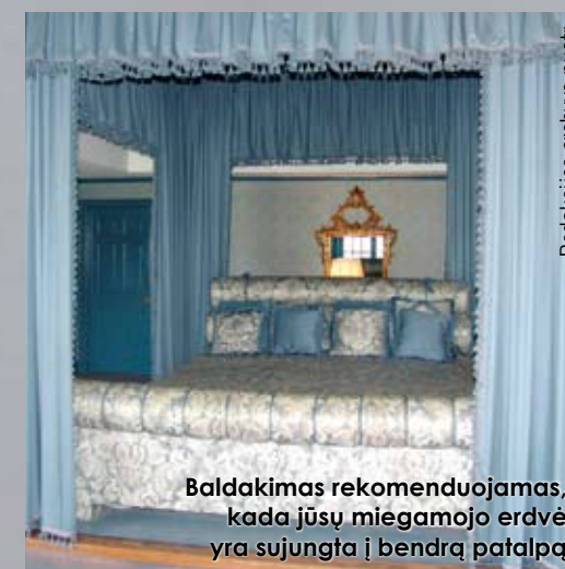
Baldakimas rekomenduojamas, kada jūsų miegamojo erdvė yra sujungta į bendrą patalpą