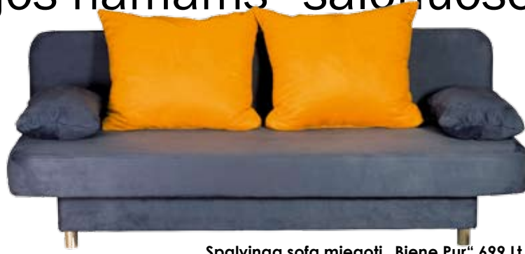
Spalvinga sofa miegoti „Biene Pur“ 699 Lt

Baigę mokyklą būsimieji studentai tampa tikraisiais. Daug nerimo tėvams ir džiaugsmo atžaloms suteikiantis virsmas reikalauja nemažai lėšų. Tad kodėl nesutaupius kad ir perkant stilingus baldus naujajam studento būstui? Naująją veiminių knygų kolekciją kompaktiškai ir išdidiškai sukomponuoti dabar galite džiama banketė „Puff“ (tik 599 li-