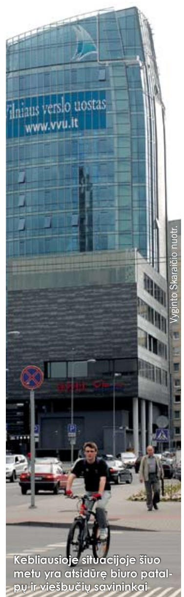
Kebliausioje situacijoje šiuo metu yra atsidūrę biuro patalpų ir viešbučių savininkai

2009 M. II KETVIRTĮ IR TOLIAU BUVO FIKSUOJAMAS SPARTUS KOMERCINIŲ PATALPŲ NUOMOS IR PARDAVIMO KAINŲ MAŽĖJIMAS, AUGANTIS LAISVŲ PATALPŲ LYGIS, O NIŪRIOS EKONOMINĖS ŠALIES PROGNOZĖS GALUTINAI IŠSKLADĖ ŠIO SEKTORIAUS DALYVIŲ LŪKESČIUS.