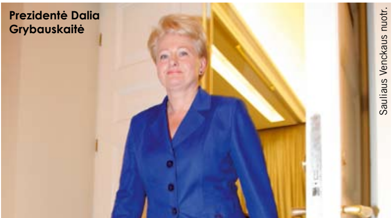
Prezidentė Dalia Grybauskaitė