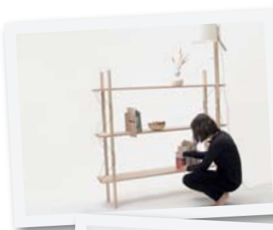
Mobilus šviestuvai „Extensions“