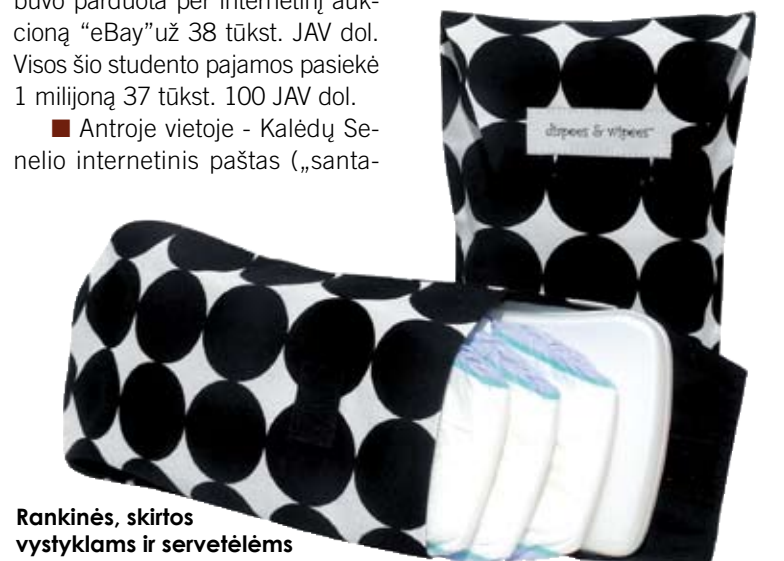
Rankinės, skirtos vystyklams ir servetėlėms