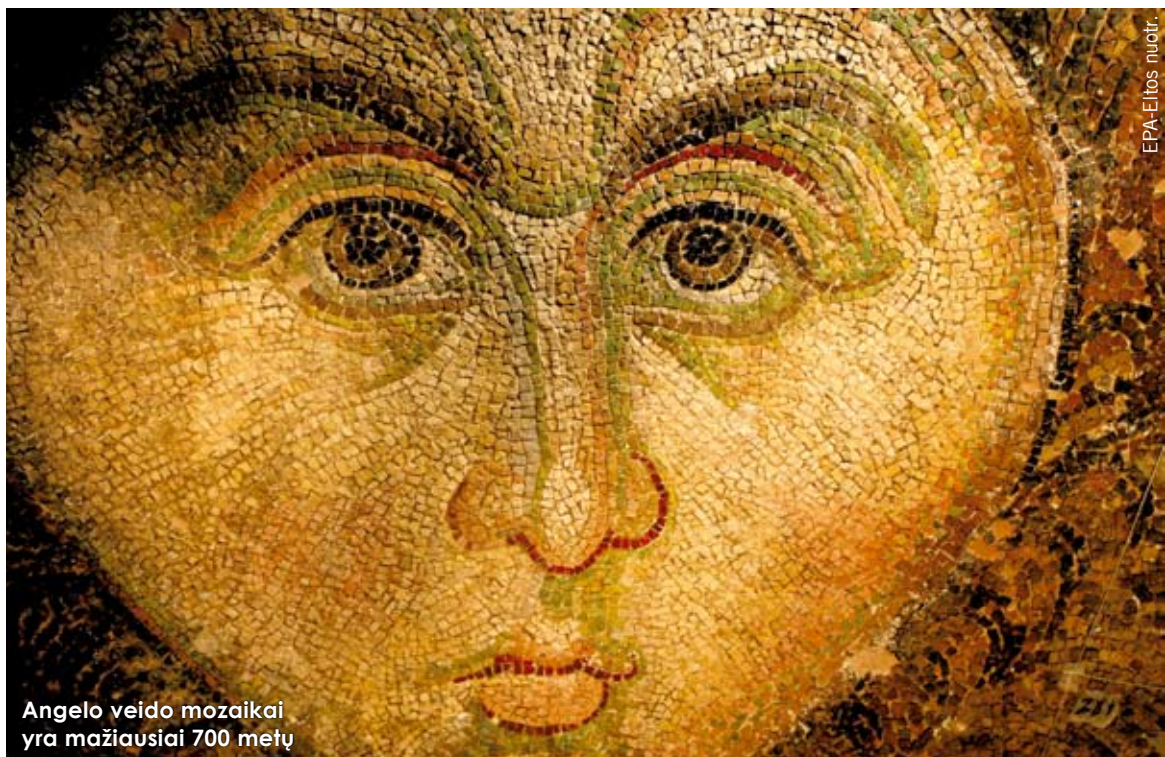
Angelo veido mozaikai yra mažiausiai 700 metų