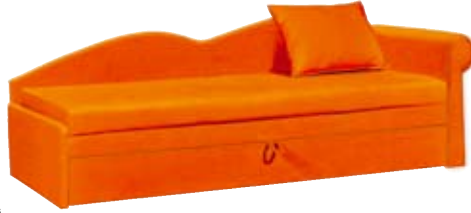
Dviviė tachtą „Magda 2“ dabar kainuoja 499 Lt