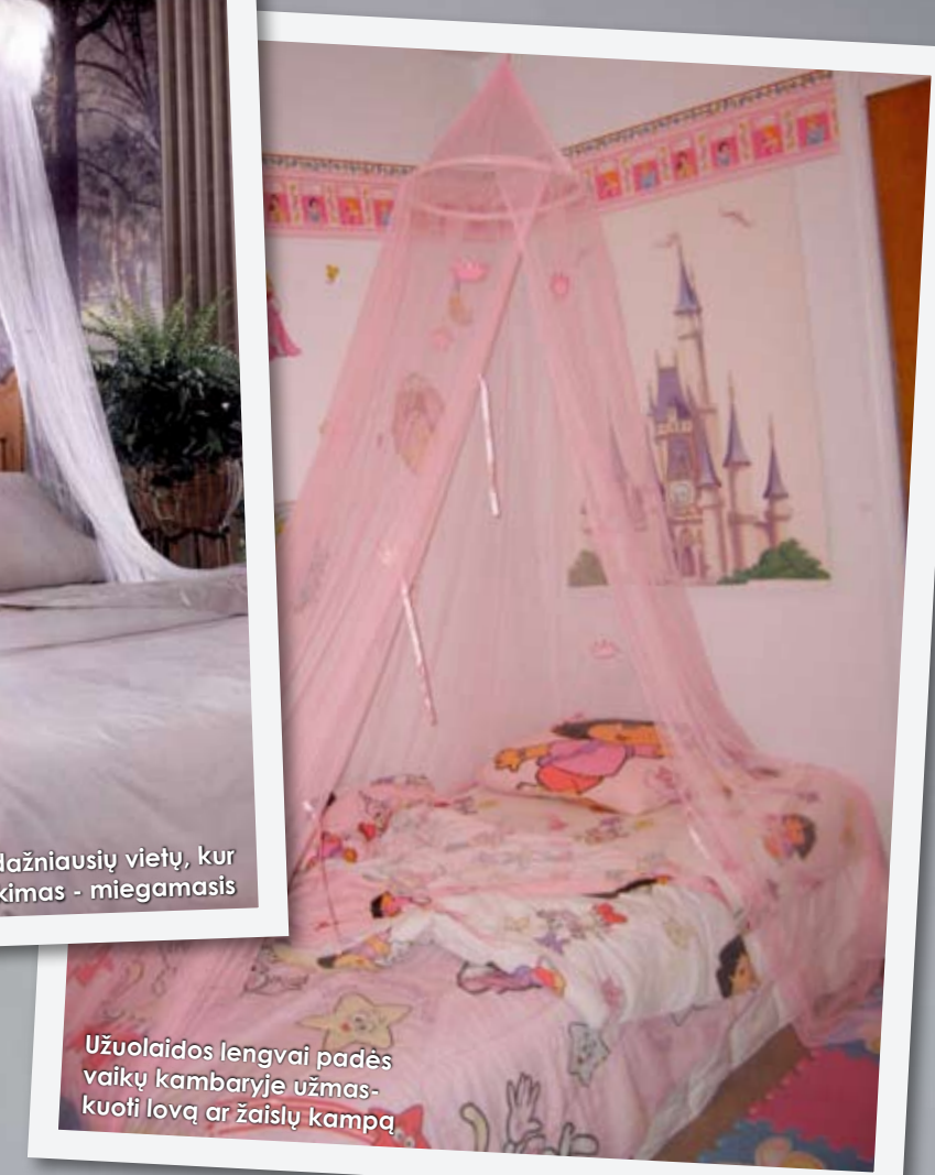
Užuolaidos lengvai padės vaikų kambaryje užmaskuoti lovą ar žaislų kampą