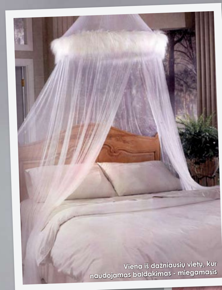
Viena iš dažniausių vietų, kur naudojamas baldakimas - miegamasis