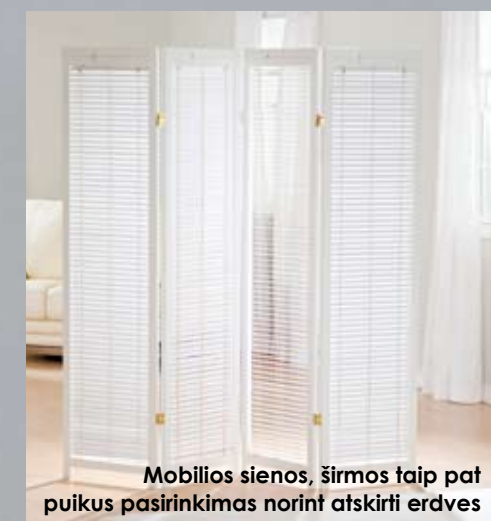
Mobilios sienos, širmos taip pat puikus pasirinkimas norint atskirti erdves