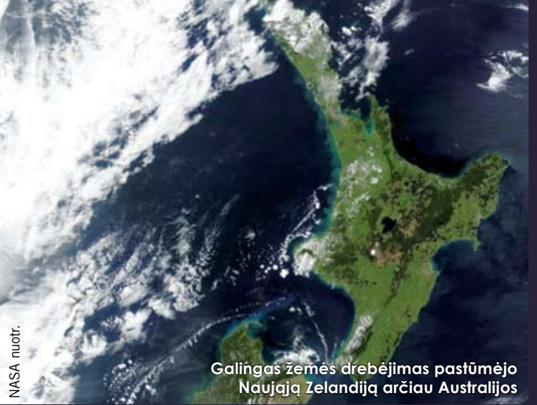
Galingas žemės drebėjimas pastūmėjo Naująją Zelandiją arčiau Australijos