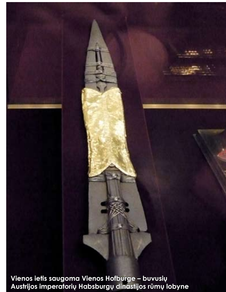
Vienos ietis saugoma Vienos Hofburge – buvusių Austrijos imperatorių Habsburgų dinastijos rūmų lobyne