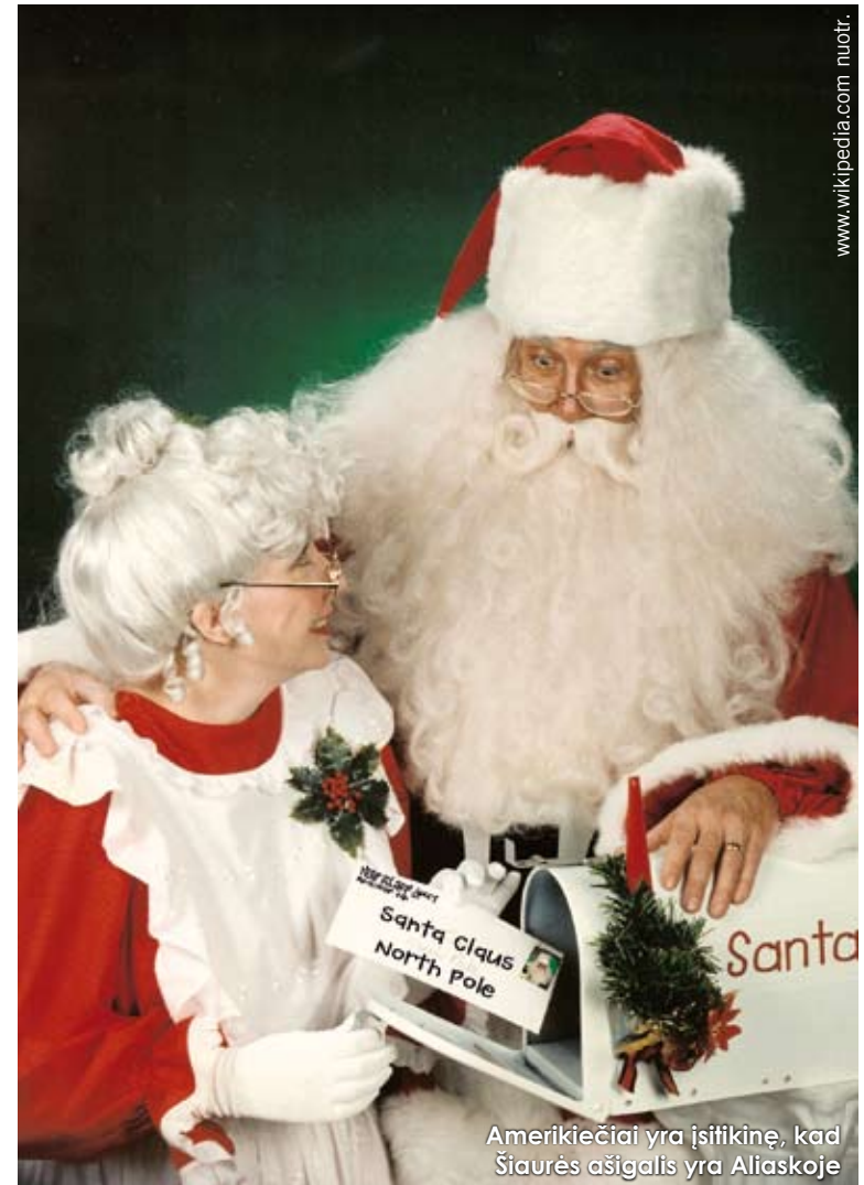
Amerikiečiai yra įsitikinę, kad Siaurės ašigalis yra Alaskoje