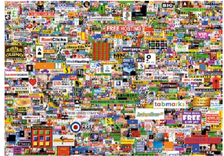
Interneto puslapis, vertas 1 milijono JAV dol. „milliondollarhomepage.com“