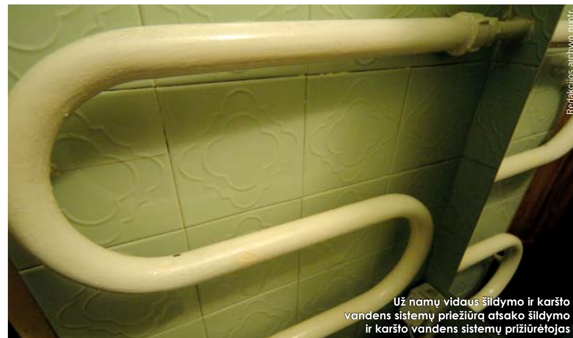
Už namų vidaus šildymo ir karšto vandens sistemų priežiūrą atsako šildymo ir karšto vandens sistemų prižiūrėtojas

Gerbiamieji „Pastogės“ skaitytėjai, klausimus specialistams siųskite adresu: pastoge@republika.net arba juos galite pateikti „Pastogės“ telefonu (8-5) 261-79-08 darbo metu.