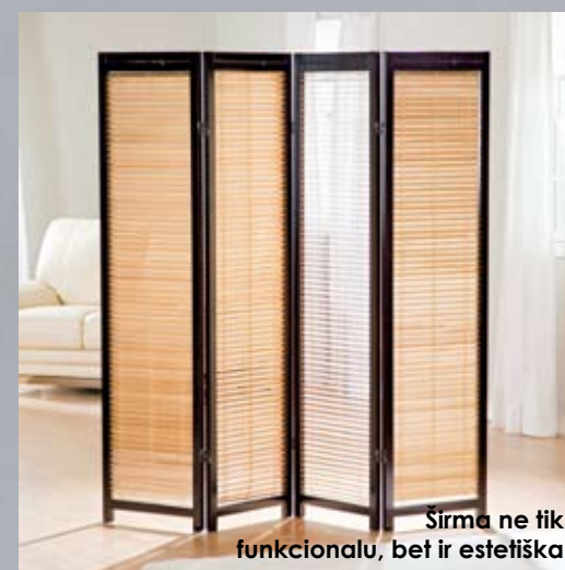
Širma ne tik funkcionalu, bet ir estetiška

3 – Visuomeninio artumo sfera (1,5-4 m). Būtent toks atstumas mums leidžia jaustis gerai tarp nepažįstamų ir pašalinių žmonių.